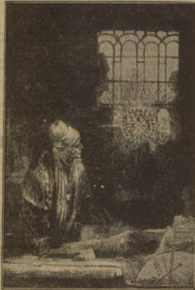
Haust im Studierzimmer — Radierung von Rembrandt

Welt der Zwietracht stelen einst die Worte der Erlösung: „Niemand hat größere Liebe denn die, daß er sein Leben läßt für seine Freunde.“ Wir Deutschen, die wir heute auf die vielen Leidensstationen unseres Volkes zurückblicken, wissen nur zu gut, wie schwer unser Weg von Golgatha nach Golgatha in Wirklichkeit gewesen ist, wie wir mit letzter Kraft kämpfen und bidden und bluten mußten, um wieder zur Reife, zur Auferstehung zu gelangen. Viele, denen dieser Kampf zu bitter und aussichtslos erschien, verjagten, andere fruchtlos, gingen, fremden Klängen folgend, in die Irre, und nur Klein war zu Beginn des