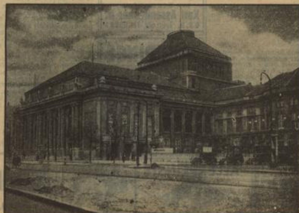
Die Städtische Oper in Berlin-Charlottenburg, die aus dem Besitz der Stadt Berlin auf das Reich übergegangen ist, wird als reichseligenes Institut unter dem neuen Namen „Deutsches Opernhaus“ weitergeführt.