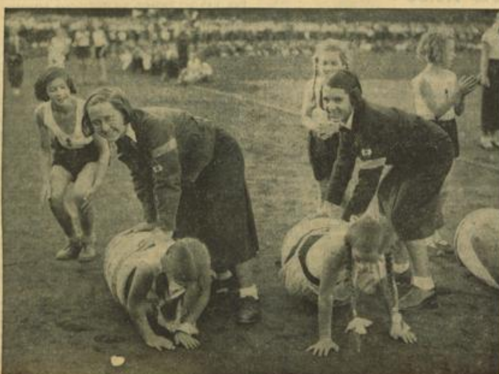
AbM-Kinder sammeln sich bei frühlichem Spiel in Sonne und Wind.