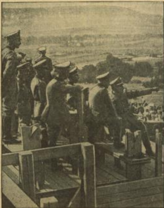
Regierungsrat Gutterer, der Organisationsleiter des Erntedankfestes, beschäftigt mit Reichswehroffizieren die Vorbereitungen auf dem Bückeberg, wo das deutsche Volk am 30. September sein Erntedankfest feiert

kreuzes des Weltkrieges für den Antragsteller mit keinerlei Kosten verbunden ist. Sowohl die Antragsvordrucke wie die Ehrenkreuze und Befähigungsnennungen werden unentgeltlich ausgeteilt. Auch etwaige mit der Verleihung zusammenhängende Verhandlungen, Urkunden und Bescheinigungen sind gebühren- und stempelfrei.