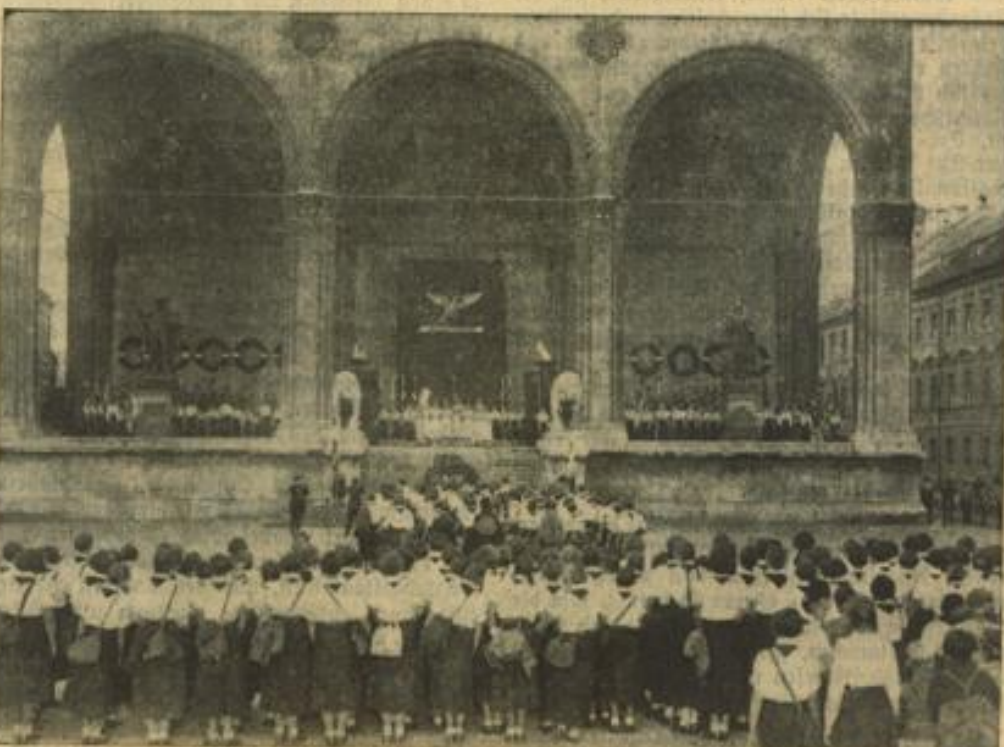
Am 23. September 1934 fand in ganz Deutschland der Reichssporttag des Bundes deutscher Mädchen statt. In München marschieren die Abordnungen des BdM vor dem Mahnmahl auf, um die Gefallenen der Bewegung zu ehren.

Obstpressen, Obstmühlen, Krauthobel, Dosenverschluß, Apparate, Einmachgläser, Eisenwerkzeuge, Pfeiffer, K1, Schreibmaschinen, Bürobedarf, nur von JOS. ARZT, Inserieren bringt Gewinn, Wervon Tapeten spricht der Markt in Böllinger Qualität - Auswahl - richtige Preise, Böllinger Tapeten - Linoleum - Seckelheimerstr. 4