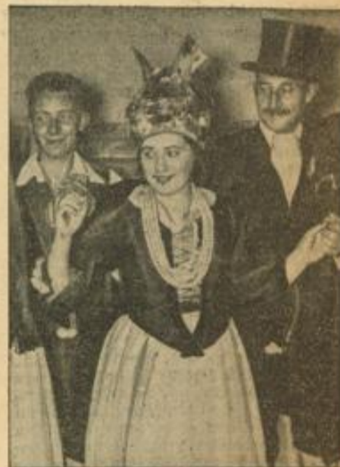
Hermann-Löns-Gedenkfeier in der Reichshauptstadt

Die NS-Gemeinschaft „Kraft durch Freude“, Gau Groß-Berlin, veranstaltete zum 20. Todestag des Heidedichters einen Hermann-Löns-Abend. Eine Trachtengruppe aus der Lüneburger Heide gab durch Ausführung von Volkstänzen der Feier einen besonderen, heimatnahen Charakter