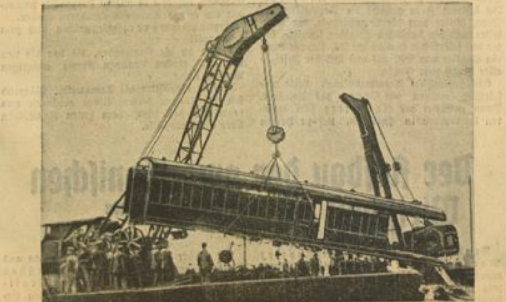
Dieses Bild von dem schweren Eisenbahnunglück bei Liverpool, nahe der Stadt Barrington, berichtet von den Aufräumarbeiten.

er! emänner! unserer orführung 2. Oktober, pand's 8 Uhr Restaurations ziskushau) gratis! Schwager ngerufen. 1934 liebendes; er Oktober, aus statt. entschlief ren Magen- r, Herr München 1934. bilibenent Mann nachm. nheim aus. elgerungen 2. Oktober 1934. hr, werde ich in On 6. 2. gearn Golltrechungsweg niewich, 1. Stamm- Küchsch, Wapel famliges erichtwohlsieber. markt eferungen Blatt. (8653) Blatt, 3. 6. Geflügelhof mit Wohnung zu verkaufen. zu ertr. unt. 97. 6025 in der Grp. Landhaus in Redargemünd, euerfrei, 4 Räume große Terrasse u. Garten (10.000 qm 1000) zu verkaufen. Kaufpreis u. 6027 an die Grp. d. W. Ihre Winter- kartoffeln lagern luftig und trocken in meinem best- bewährten Kartoffel- ständer Faulen und Keimen nicht möglich. Bazlen am Paradepl.