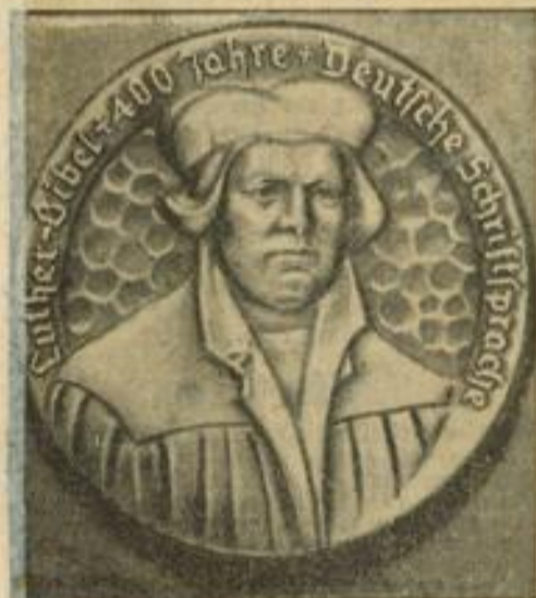
Das Festabzeichen für den Deutschen Bibeltag 1934 Für den Deutschen Bibeltag 1934, der im ganzen Reich mit einer Reihe von Veranstaltungen begangen wird, wurde dieses Festabzeichen nach einem Steinbild Luthers aus dem Jahre 1540 geschaffen.