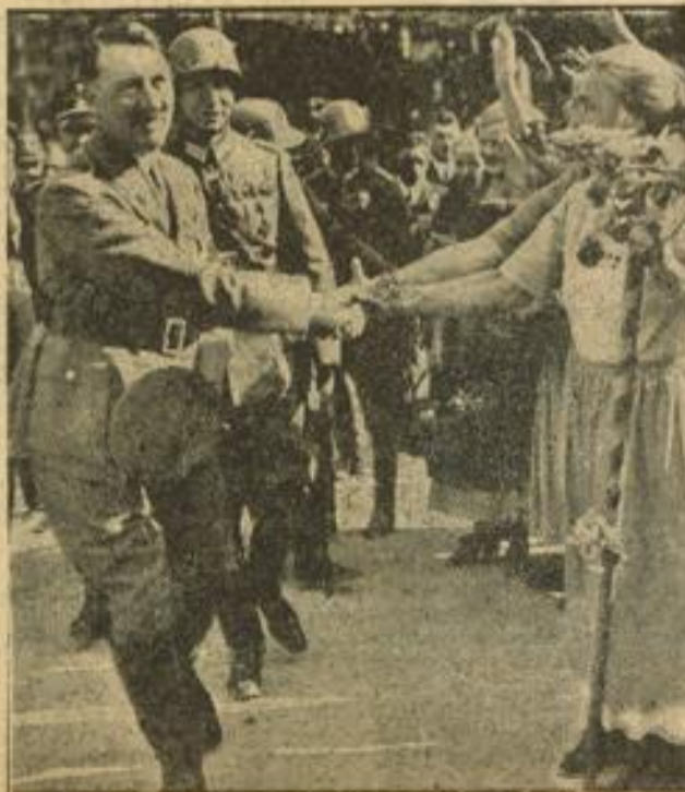
Tafel um den Führer Der Führer begrüßt die vor der Kaiserpfalz versammelten Bauernabordnungen aus dem Reich