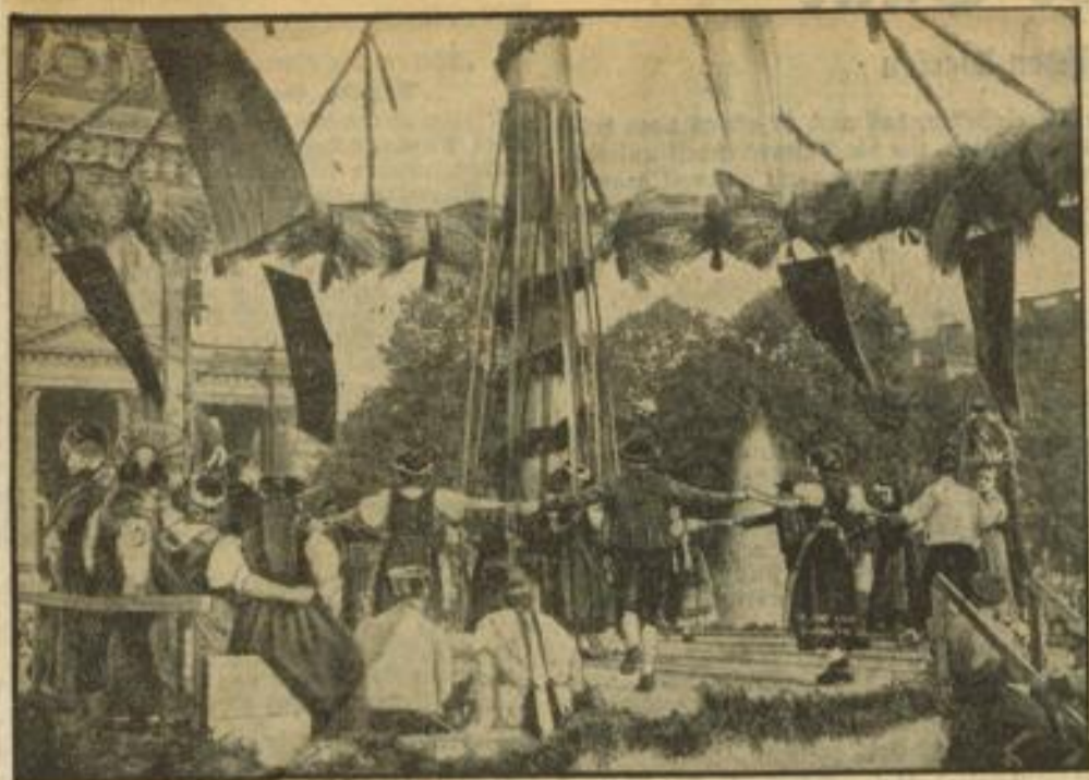
Unter dem Motto „Stadt und Land — Hand in Hand“ feierte die Reichshauptstadt das Erntedankfest. Nach dem Empfang einer Bauernabordnung im Rathaus werden im Lustgarten Volkstänze aufgeführt.