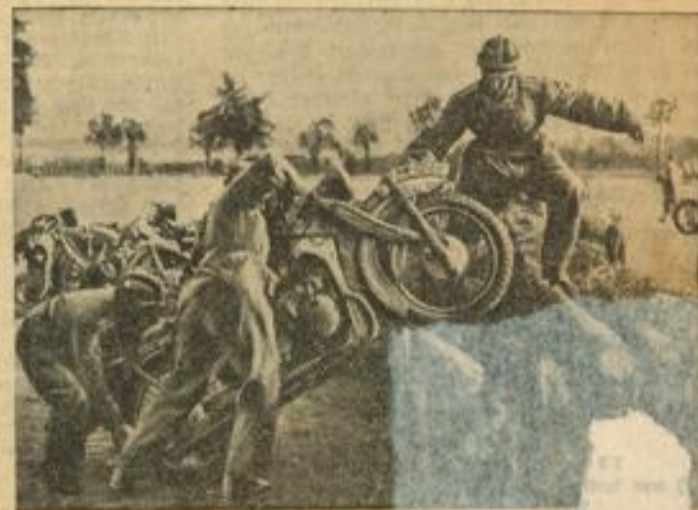
Motorräder nehmen Hindernisse Auf dem Sportplatz Lötzhin veranstaltete das Reichsarbeitsdienstkommando Jossen am Sonntag ein Sportrennen, an dem diese interessanten Rennen für Motorräder zur Auswertung gelangten

ren reich erpen el wur- je der Rohe Stellun- itte der ändert. ngenden chreiten Dest- Franzo- je Vor- ten für or Ant- St. Ca- elst mit g 5 Uhr ist ein- schobene e befin- auf dem der Vor- Nemen alki be-