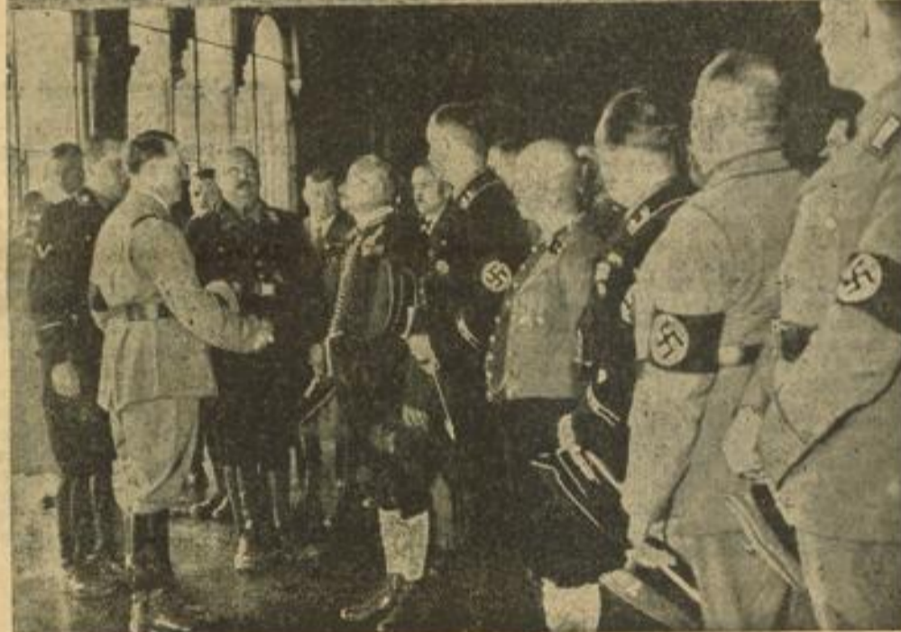
Der Führer in Goslar Oben: der Führer schreitet die Front der Ehrenformationen des NS-Arbeitsdienstes ab; links: Reichsarbeitsführer Hierl — Unten: der Empfang der Bauernabordnungen aus dem Reich in der Kaiserpfalz; links hinter dem Führer: Reichsbauernführer Darré