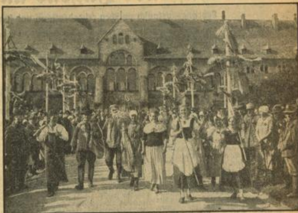
Bauern aus allen Gauen Deutschlands nehmen in ihren Helmattrachten an den Feiern in Goslar teil. Unser Bild zeigt Bauern aus der Harzer Gegend. Im Hintergrund die Kaiserpfalz.