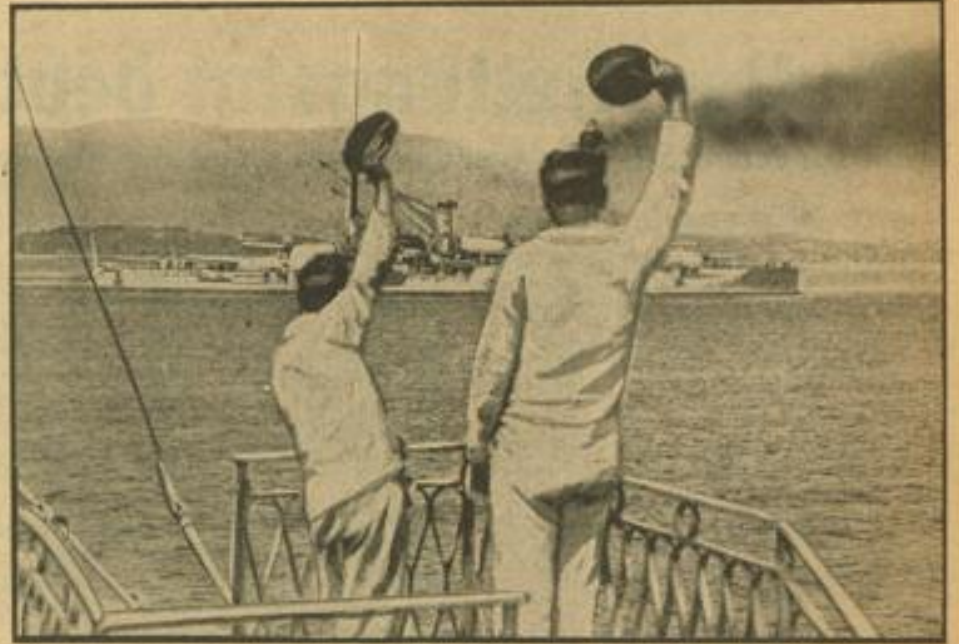
Französische Flottenmanöver im Mittelmeer Matrosen grüßen das Flaggschiff „Lorraine“ beim Verlassen des Hafens von Toulon.

Schließlich weist der Korrespondent der „Morning Post“ zu melden, es könne kein Zweifel bestehen, daß die französischen Generalstabe in dem Abkommen mit England einen wertvollen Schulfall für eine gegenseitige Unterstützung „bei einer zukünftigen ernstlichen Gelegenheit“ sehen. Diese Erwägung spiele eine immer wichtigere Rolle.