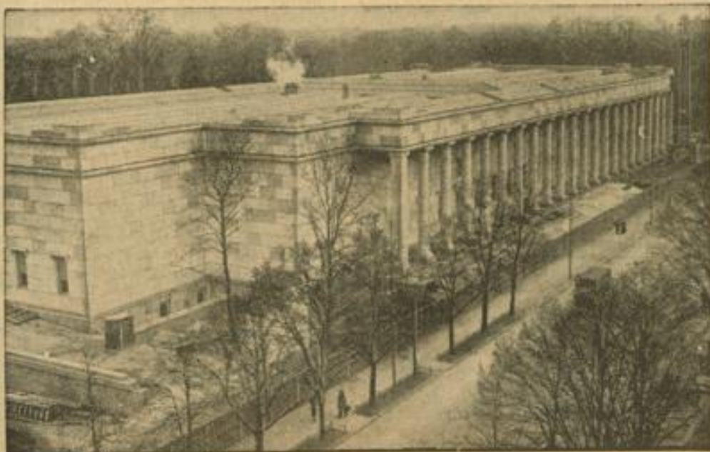
Haus der Deutschen Kunst in seiner jetzigen Gestalt Mächtig dehnt sich die 175 Meter lange Säulenfront an der Prinzregentenstraße in der Hauptstadt der Bewegung. Unser Bild gibt einen Eindruck von den Ausmaßen und der architektonischen Kraft dieses Bauwerks, in dem sich der deutsche Stil würdig verkörpert.

Der konservative englische Unterhausbekleidete Admiral Sir Roger Keyes hat eine Einladung zu einer Veranstaltung des Völkerbundsvereins in Portsmouth abgelehnt mit folgenden Worten: „Die irreführenden Bemühungen der Völkerbundsvereinsführung sind eine Bedrohung der Sicherheit des Britischen Reiches und des Weltfriedens. Die rastlosen Bestrebungen der Vereinigung, England abzurufen und gleichzeitig eine kriegerische Politik zu fördern, kann das Britische Reich in einen Krieg verwickeln, in dem unsere ungenügend ausgerüsteten Soldaten und Matrosen den Bahnsinn der sogenannten Pazifisten mit ihrem Leben bezahlen müßten.“