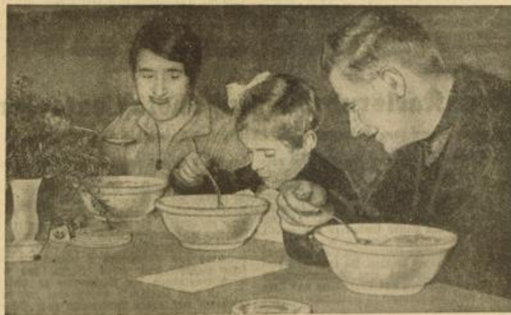
Am 8. März ist Eintopf-Sonntag

Über 90 Prozent der Schülerinnen der Städt. Hausfrauenschule sind im VDM, so daß die Schule die Berechtigung zur Hiffung der VDM-Fähne besitzt. Die vorbildliche Einrichtung und Schulung der Hausfrauenschule bietet die Gewähr dafür, daß unsere jungen Mädchen zu tüchtigen Hausfrauen erzogen werden, die deutsch denken und fühlen und die, selbst wenn sie es nicht nötig haben sollten, doch überall zu fassen können und überall Respekt wissen. z.