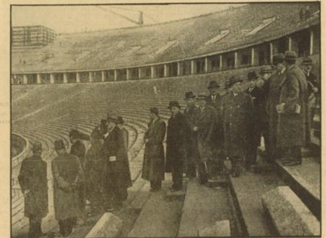
Ausländische Zeitungsverleger in Deutschland