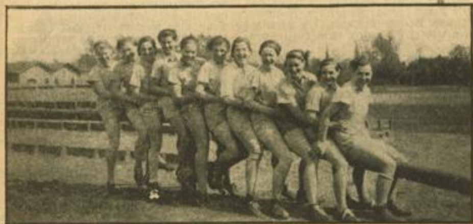
VIR Mannheim Badischer Frauen-Handballmeister

Der Niederrhein-Fußballmeister Fortuna Düsseldorf wird an den Pfingsttagen eine Polenreise unternehmen. Es sind drei Spiele in Posen, Warschau und Lodz gegen führende polnische Mannschaften vorgesehen.