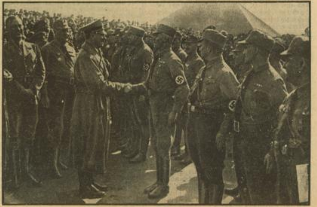
Der Führer begrüßt den Stoßtrupp Hitler 1923 Der Stoßtrupp Hitler 1923, der nach dem Treffen in Stuttgart in Crössingen eintraf, nahm an der Einweihungsfeier der nationalsozialistischen Ordensburg teil.