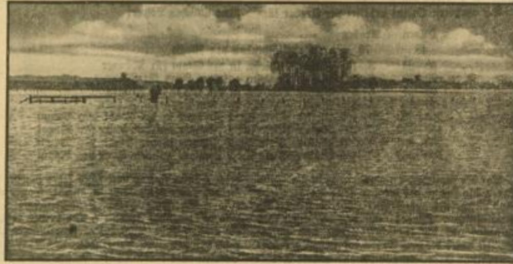
Hochwasser in Westfalen. Ein Aufnahme aus der Nähe von Hamm. Von hier bis Lippstadt ist durch Schneeschmelze und Regenfälle die Lippe über ihre Ufer getreten...