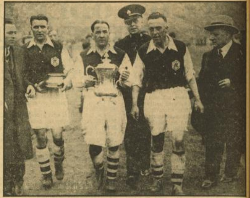
Fast 100 000 Zuschauer beim Pokalspiel zwischen Arsenal und Sheffield United im Stadion von Wembley. Das Spiel ist aus und der Pokal errungen.