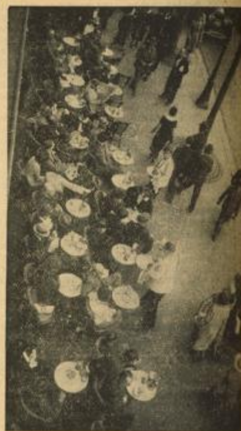
Ein Lokal auf dem Bürgersteig. Ein typisches Bild aus der französischen Hauptstadt. Paris erlebt die erste Hitze dieses Jahres.