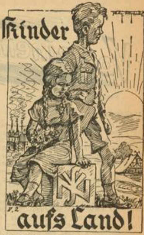
Gibt der NSV Freiplätze!