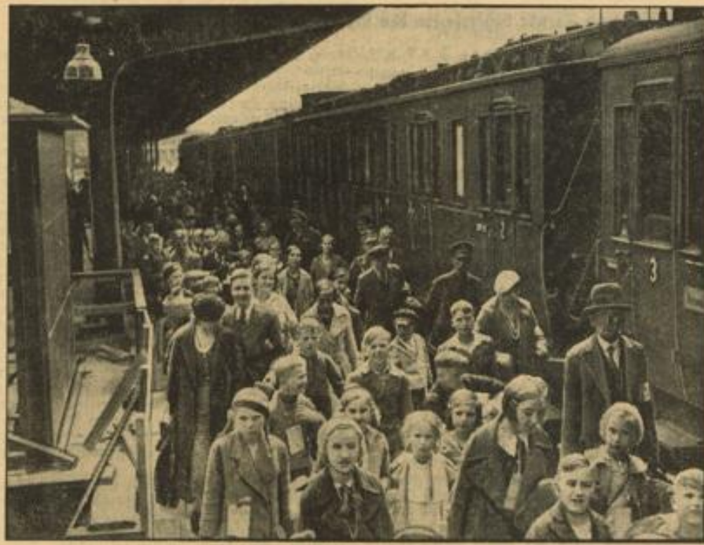
Mütter und Kinder kehren vom Erholungsurlaub heim. Ein Mütter- und Kindertransport des Amtes für Volkswohlfahrt der NSDAP, das auch in diesem Jahre Müttern und Kindern einen sechswoöchigen Erholungsurlaub in den schönsten Gauen Deutschlands bietet, kehrt in die Heimat zurück.

Das Leistungsabzeichen zeigt das Hakenkreuzabzeichen der DAF, hinter ihm einen Hammer, an dessen Stiel Eichenlaub liegt und trägt die Aufschrift „Von der Deutschen Arbeitsfront anerkannte Berufserziehungsstätte“. Es wird in den Räumen oder über der Eingangstür des Betriebes angebracht und kann in gleicher Form im Briefkopf der Ausbildungsstätte geführt werden. Gleichzeitig wird durch eine künstlerisch ausgeführte Urkunde, die in der Form eines Berufsbuches gehalten ist, die Verleihung bestätigt. In dieses Buch werden die Ergebnisse der Besichtigungen durch beauftragte Vertreter des Amtes eingetragen. Diese Besichtigungen finden einmal jährlich statt und bestimmen, ob das Leistungsabzeichen von der Ausbildungsstätte weiterhin geführt werden darf. Das Zeichen bleibt, dem Leistungsprinzip des Nationalsozialismus entsprechend, das auch fortlaufend Leistungen fordert, nur im Besitz einer Ausbildungsstätte, solange die Verleihungsbedingungen erfüllt sind.