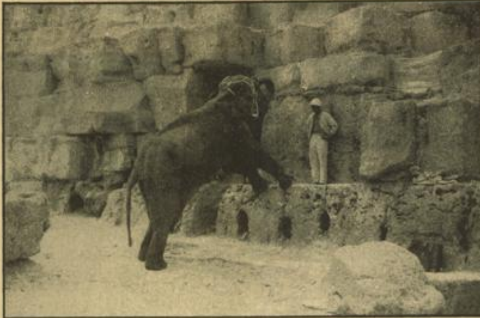
Eine interessante Aufnahme einer der dressierten Elefanten vor der Pyramide von Gizeh.

Ein einziger Triumphzug war die Fortsetzung der Weltreise von Japan über das geheimnisvolle Indien nach Kairo, das besonders reich an Abenteuern für die deutschen Zirkusleute war, und überall die gleichen Eindrücke: Ehrliche, rüchhaltige Begeisterung für die besten Vertreter deutscher Zirkuskunst. Der Besuch der Vorstellungen war überall außerordentlich stark — ein Beweis für die Qualität und die Leistungen des Unternehmens, das immer bestrebt war, die Nation würdig zu vertreten und zweifellos zu seinem Teil an der Veredelung der Völker untereinander nach Kräften beizutragen.