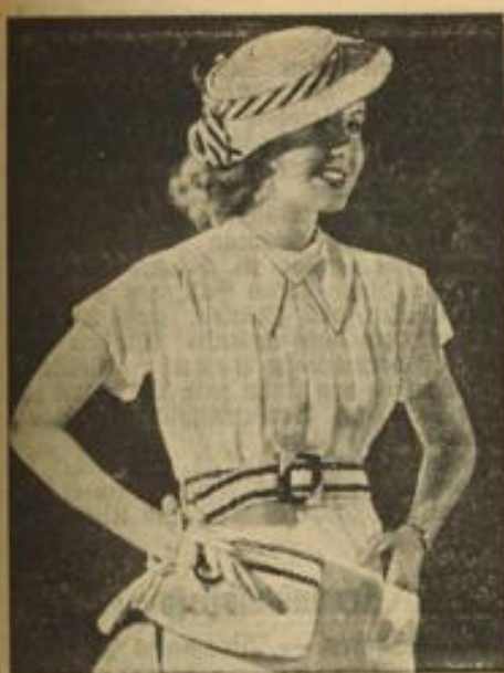
Lustig und leicht Weltbild (M) Ein weißes Sommerkleid mit schwarz-weißem Gürtel.