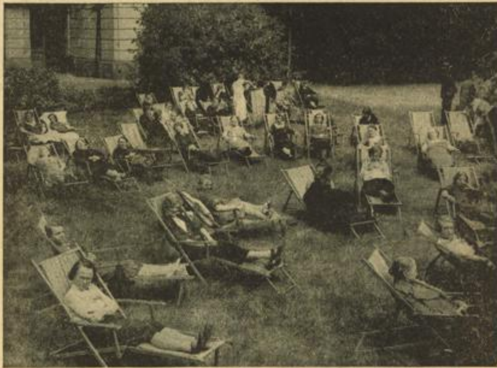
Im Erholungshelm der NSV finden die Mütter neue Lebenskraft.