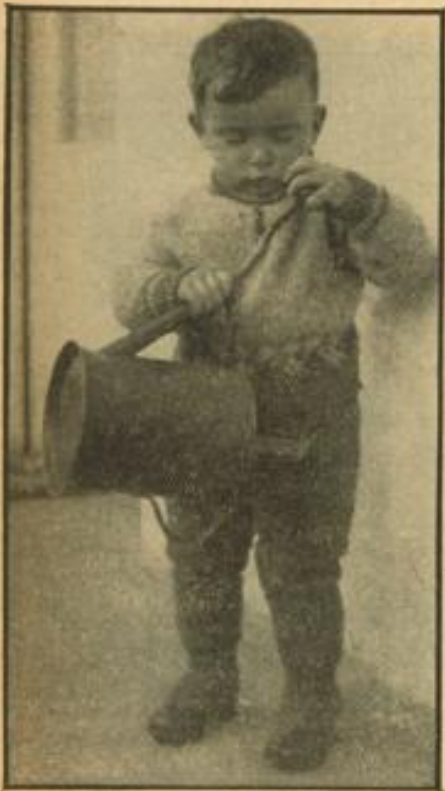
Der kleine Gärtner. Aut.: Wagner

Verbesserung der Mütter- und Säuglingsfürsorge / Keine Rückzahlung mehr / Verdienstaugliche und Stillprämien