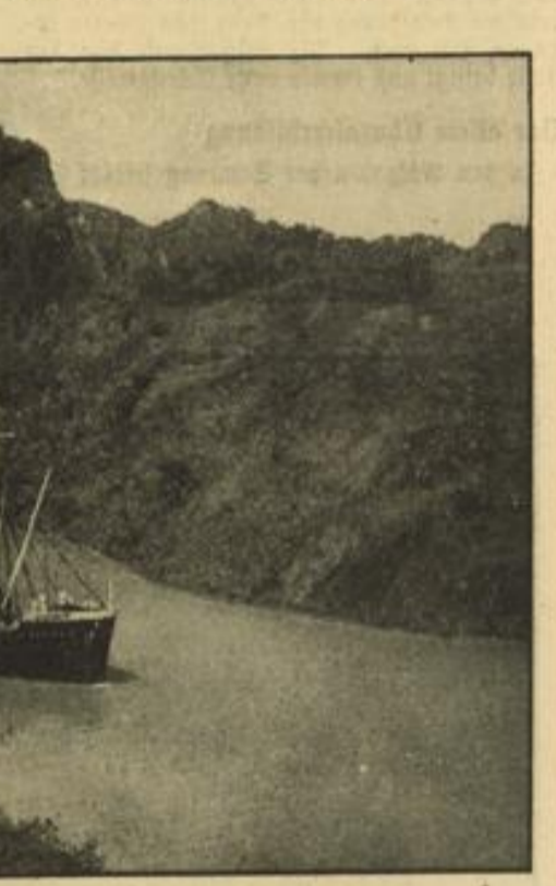
Mit deutscher Ware reich beladen. Das Hapag-Motorschiff „Hermionthia“ passiert auf der Fahrt zur Westküste Amerikas den Panamakanal...