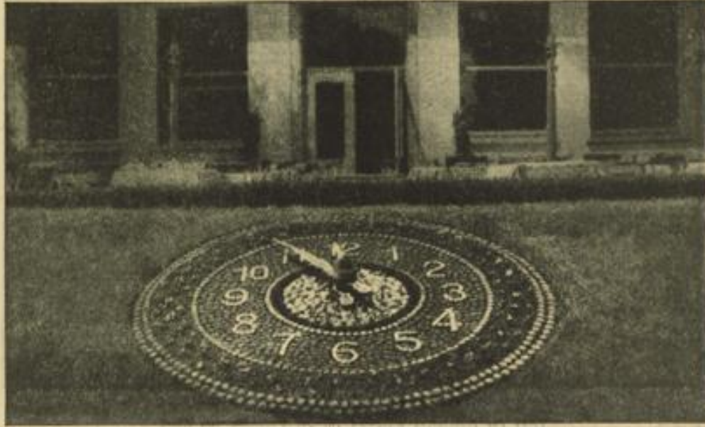
Die Blumenuhr im Friedrichspark