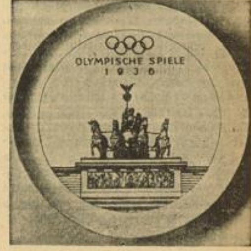
Erinnerungsschale für die Olympischen Spiele Die Quadriga vom Brandenburger Tor in Berlin auf der von der Staatlichen Porzellanmanufaktur Meissen hergestellten Erinnerungsschale in Blauweiß-Technik, geschaffen von Hermann Limbach. Die Porzellanschale hat einen Durchmesser von 17,5 Zentimetern und ist zum Anhängen und Aufstellen geeignet. Weißbild (M)

chräbsten Nation, wenn sich ein Priester Leovigile heuchlerisch in den Beichtstuhl setzt und das Wissen um die sexuelle Rot seines Beichtstuhles für seine eigene etelnde Verantlagung mißbraucht, wenn dieser „Seelforger“ noch obendrein durch die Klaffen der Schulen geht, Religionsunterricht erteilt, den Katechismus lehrt und als „leuchtendes Vorbild“ junge Novizianten auf das lebendige Grab des Klosterslebens vorbereitet.