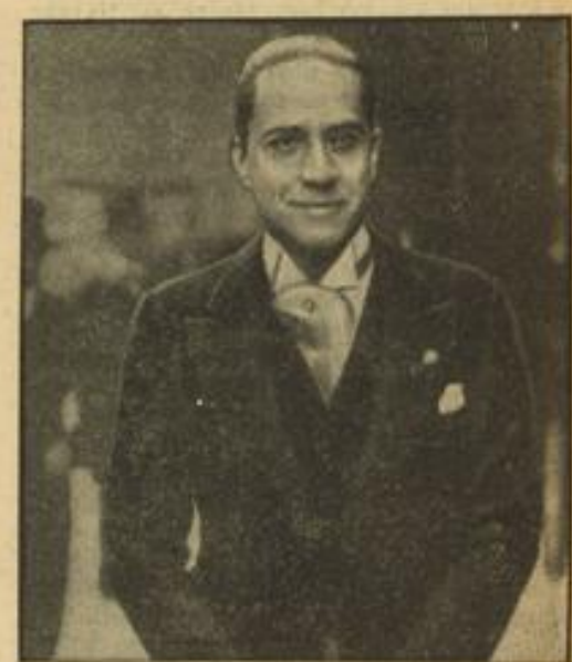
Der neue italienische Außenminister, Graf Galeazzo Ciano, wurde im Zuge einer teilweisen Umgestaltung der italienischen Regierung mit der Führung des Außenministeriums betraut.

Weise sein Bedauern darüber ausdrückte, daß die Staatsanwaltschaft sich nicht entschlossen habe, die Angelegenheit weiter zu verfolgen. Nur auf diesem Wege wäre ihm die Möglichkeit gegeben, seine Unschuld zu beweisen. Gegen den Spruch des Sondergerichts gebe es keine Revision.