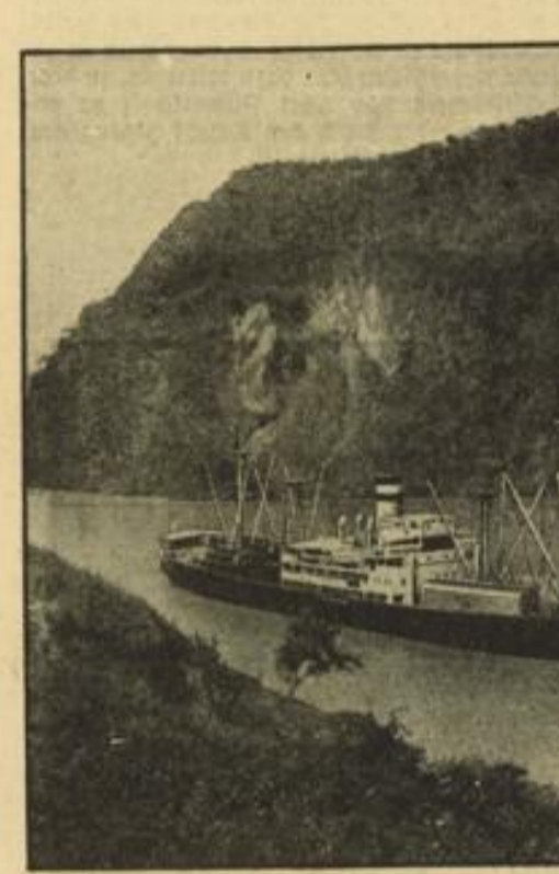
Mit deutscher Ware reich beladen. Das Hapag-Motorschiff „Hermionthia“ passiert auf der Fahrt zur Westküste Amerikas den Panamakanal...