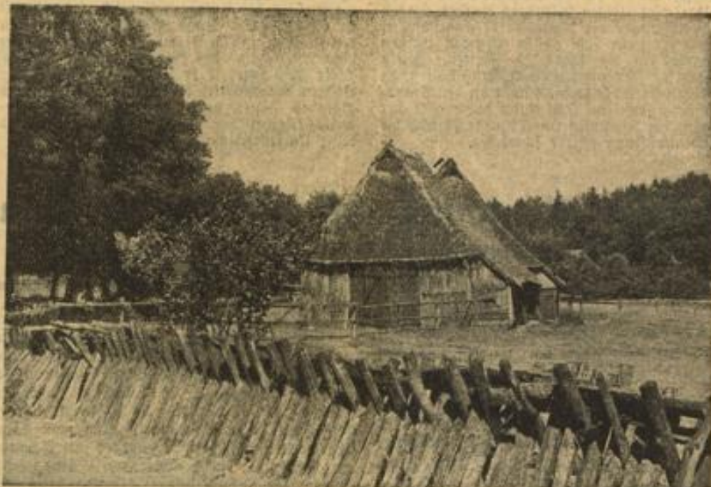
Altes niedersächsisches Bauernhaus in der Lüneburger Heide