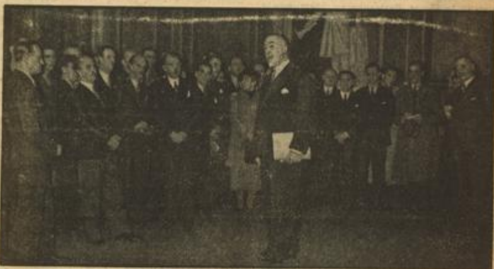
Die Londoner Philharmoniker in Deutschland. Der berühmte Dirigent des Londoner Philharmonischen Orchesters, Sir Thomas Beecham, dankt im Namen seiner Musiker für den Empfang, den die Stadt Berlin den englischen Gästen im Rathaus bereitet hat.

Wieder vier Tote in Bombay London, 13. November. In Bombay kam es am Donnerstag zu neuen Zusammenstößen, bei denen vier Personen getötet und zwölf verletzt wurden. Britische Infanterie wurde eingesetzt, um die Ruhe wiederherzustellen.