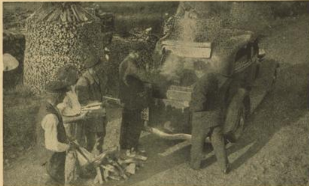
Im Holzgassauto über die Alpen

Hier liegt eine derartig klaffende Verschiedenheit von juristischer und wirklichkeitstypischer Begriffsbezeichnung vor, daß es nicht zu viel gesagt ist, wenn man in der Auffassung des Reichsgerichts ein Element der Rechtsunsicherheit erblickt.