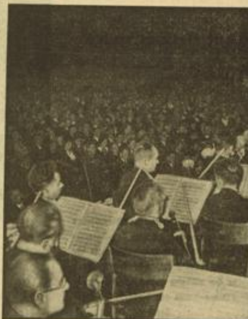
Richard Strauß dirigiert vor 14 000 Volksgenossen

Der Herr Holzschmitz zu kaufen wünscht, so kann sie ihm ja auch ich zeigen.