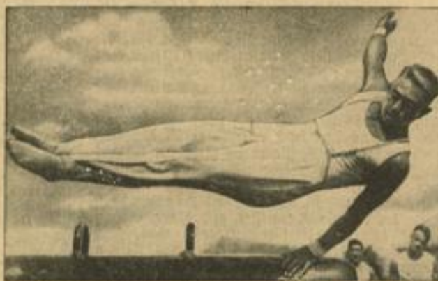
Die deutschen Geräteturner ermitteln am kommenden Sonntag in Stuttgart ihren Meister.