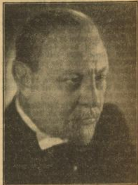
Emil Jannings in der Titelrolle des Films „Der Herrscher“