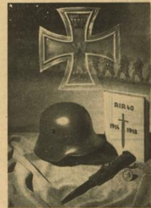
Unvergängliche Symbole alten Frontkämpfergeistes

Um 5 Uhr vormittags hand das Regiment marschbereit in Versbach am Ausgang nach Schirmdorf. Gegen 7.30 Uhr traf der Befehl ein, nach Bisch abzurücken und sich am Ortsausgang nach Herzbach aufzustellen.