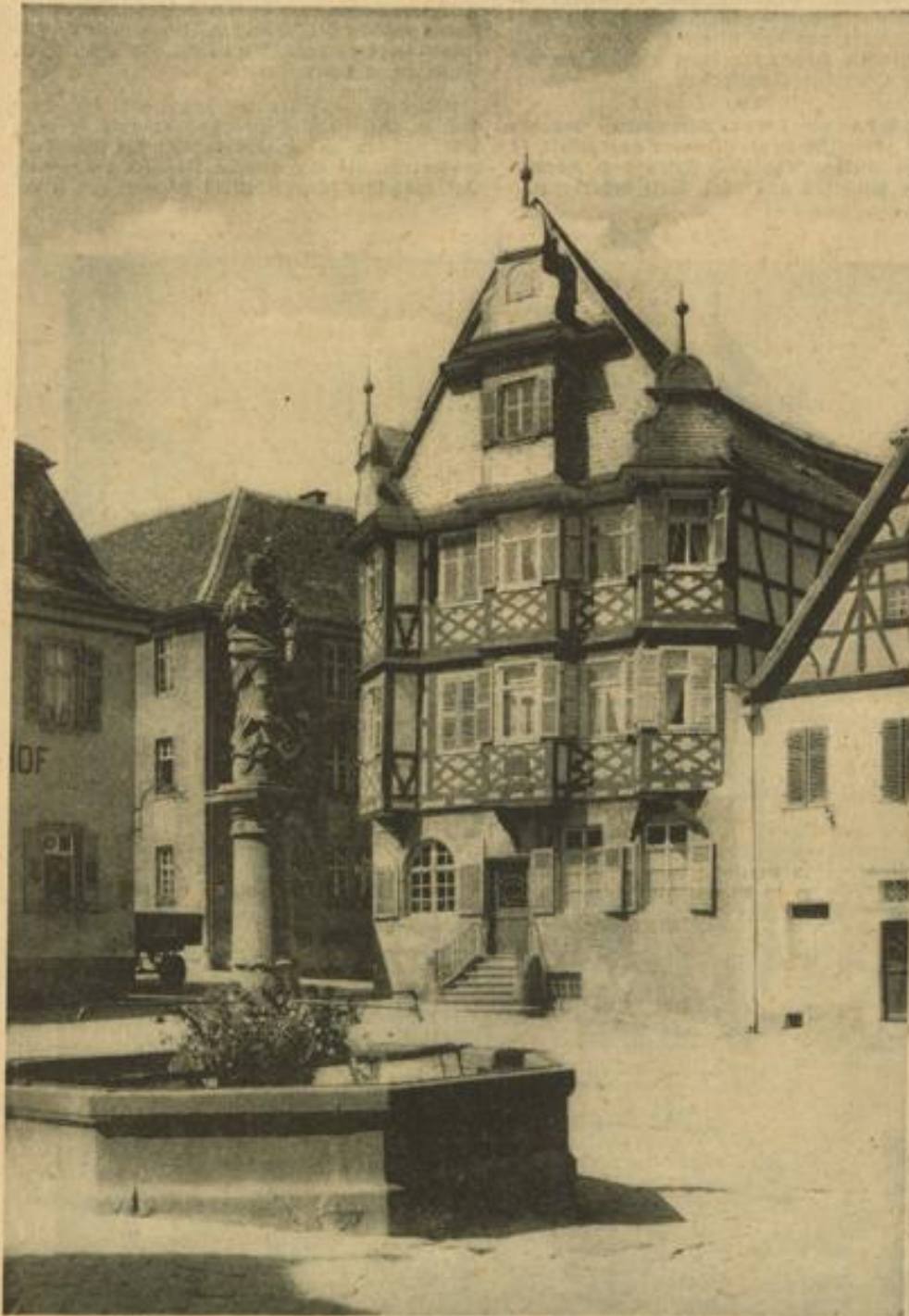
Die Liebigapotheke in Heppenheim

Wochen. Die Fahrten beginnen am 18. und 25. April, 2. und 14. Mai in Berlin (Zustiegstationen Leipzig und Frankfurt/M.) und führen nach Bensheim, ins Herz des Blütenmeeres an der Bergstraße.