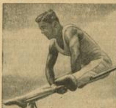
Wer wird Deutscher Turnormeister?