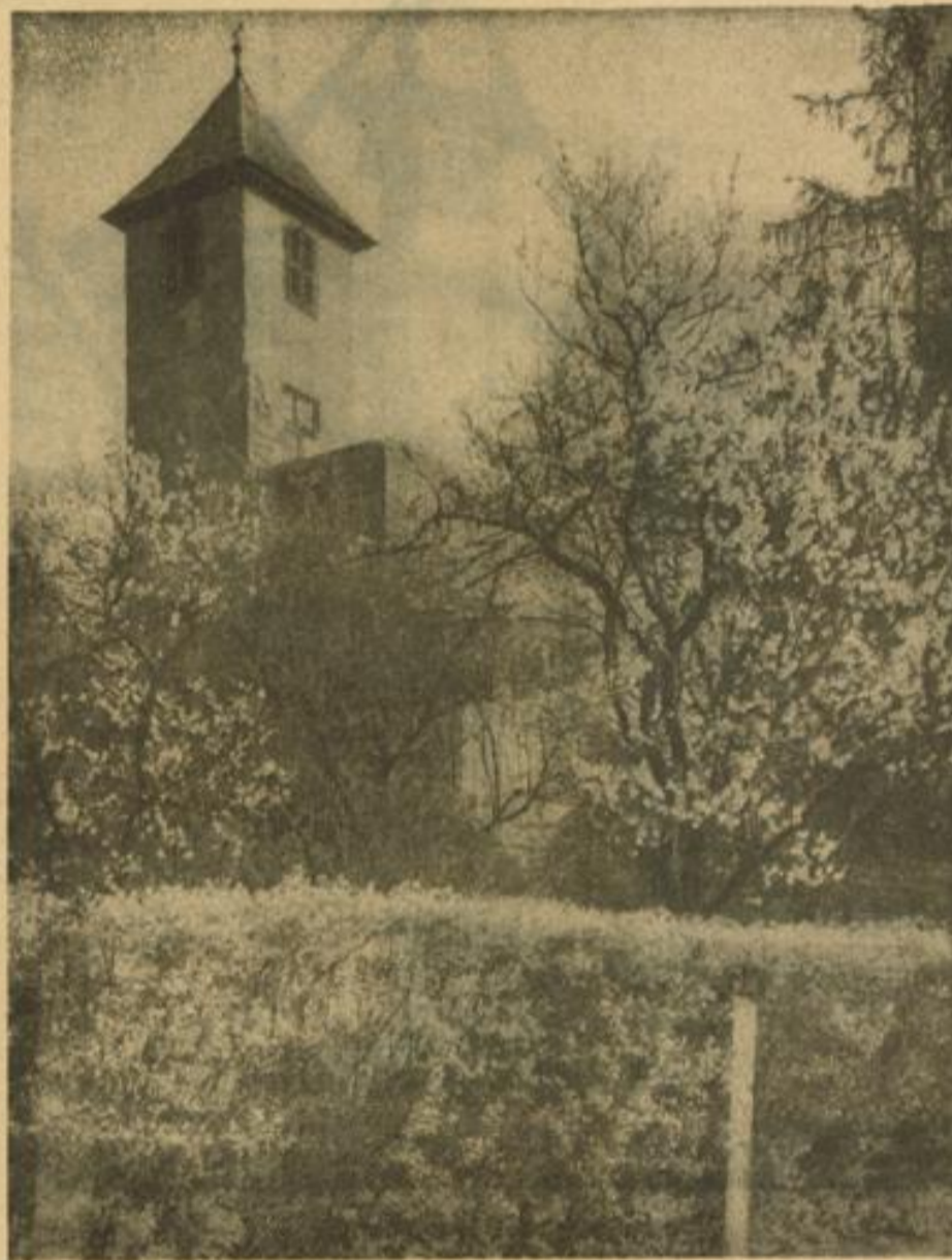
Der Freinsheimer Diebsturm ist umgeben von einem dichten Blütenkranz

Und doch — Jahre um Jahre gebe ich schon hin zu der alten Schwarzwalddauptstadt und jedesmal bin ich ein Besucher. Die Schwarzwaldberge, die wie getreue Palast rings um Freiburg ihre schneebedeckten Häupter gen Him-