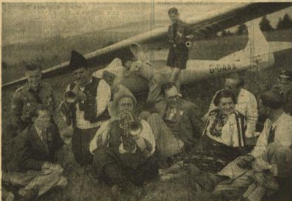
Beim internationalen Rhön-Gegefliegerwettbewerb auf der Wasserkuppe

Auf einer großen Flugvorveranstaltung anlässlich der Pariser Weltausstellung wird demnächst ein deutsches Segelfluggeschwader in Stärke von sechs Maschinen sein Können zeigen.