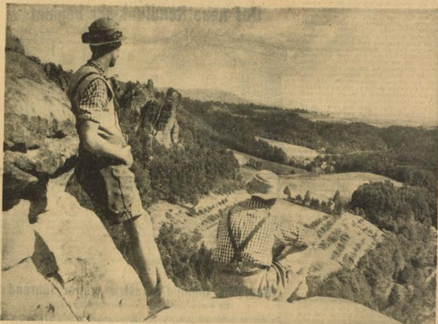
Ein Blick auf die Berge der Sächsischen Schweiz

Im Frühjahre und Herbst vor allem erlebt