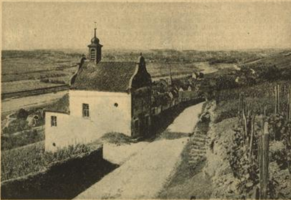
Das idyllisch gelegene Frickenhausen in Nordbayern

Sieht man auf einem Zoller dieser Westmarkburgen, man meint, noch im Geiste die Ritterschaft zu sehen, die mit stolzer Willenskraft gewappnet in leidenschaftlicher Kampflust den Gegner zu überwinden trachtete. Auch zu noch so nüchternen Menschen der Städte sprechen die Burgen und Ruinen. Und steht man längs