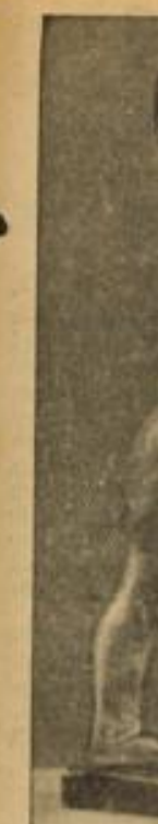
Aus der... Eine Plastik aus... nicht mehr zu...

Wissen wir noch, daß Preußen sich einen Finanzminister Dr. Leppert geleistet hat, von dem der Leiter des eingegangenen Staatsbüchters in Wiesbaden einen Ausspruch gegenüber