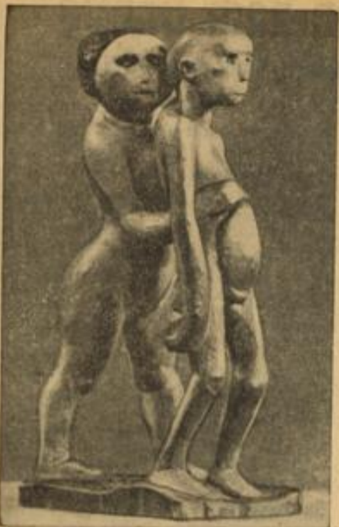
Aus der Ausstellung „Entartete Kunst“

Burgbau- nen Grenzland- ens Burgbau- Drama. „Meier ur Aufführung en, ein Werk, aufführung im in mit Fried- olgreich durch-