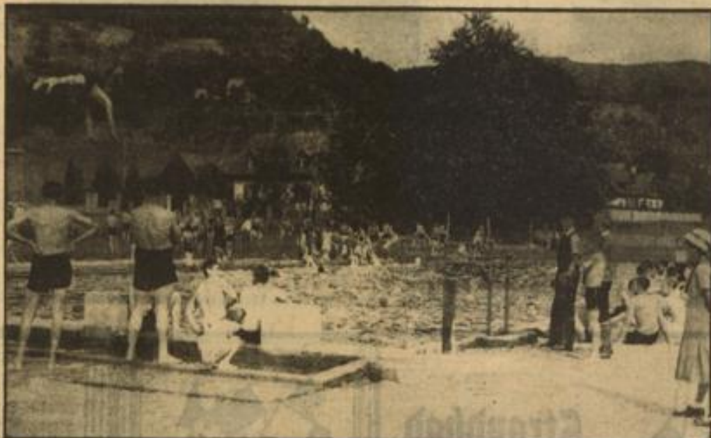
Das schöne Schwimmbad von Kappelrodeck

Waldhof oder von Hohenflum über Hellingen, Weichenhausen, Eichel, Hohenflum, Hellingen, bzw. Weichenhausen, Rinseln, Karbau, Hohenflum oder von Maulburg über Rinseln nach dem Hohenflum oder von Schopfheim über Biebs, den Hohen Flum, Nordschwaben, Dossendach nach Schopfheim; usw. Lebenslang wird man die Bekanntheit mit dem Dinkelberg in guter Erinnerung behalten und sie gerne erneuern, wenn sich dazu Gelegenheit bietet. Das reich entwickelte Industriegebiet an der Biele und entlang dem Hohenflum mit seinen mächtigen Kraftwerken hat ja auch dem technisch interessierten Reisenden viel zu sagen! O. E. S.