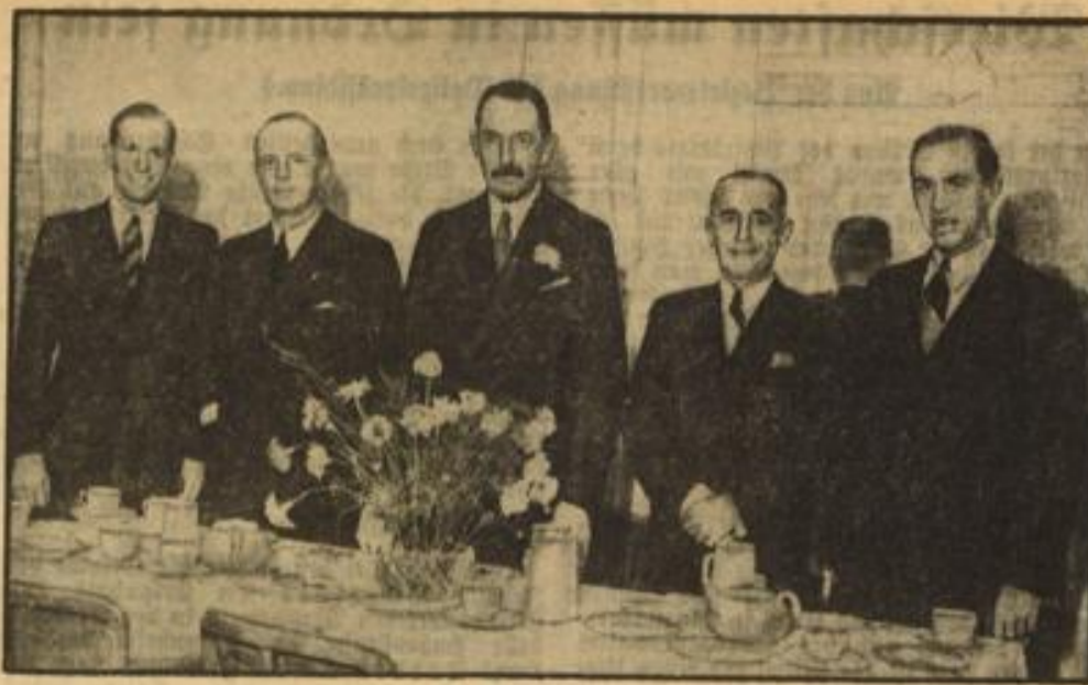
Empfang für den Reichssportführer in London. In den Räumen des St. Ermine-Restaurants in London fand ein Empfang der German-French Fellowship für den in England weilenden Reichssportführer statt.

Man erlernet sich in diesem Zusammenhang, daß bereits einmal von der Auto-Union die Aufforderung an Kuvolari erging, einen Leichten Wagen zu steuern, daß aber damals ein abschlägiger Bescheid erteilt wurde.