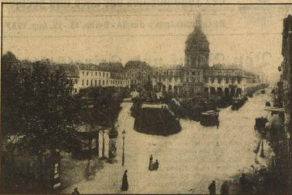
Der Paradeplatz mit dem Rathaus

Das an der östlichen Seite des Turmes angebrachte Kreuz erinnert nicht an diesen Einbruch, da hierbei Menschenleben anscheinend nicht zu Schaden gekommen sind. Wahrscheinlich ist es zur Erinnerung an einen Unglücksfall hier angebracht worden, der sich während des Baues ereignet haben dürfte.