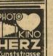
PHOTO KINO HERZ Kunststoffe N 4, 13/14