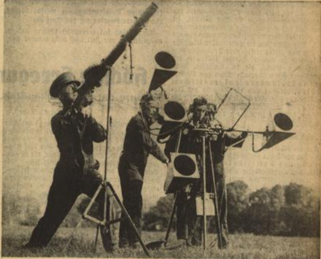
Die großen Luftmanöver über London. Am 9. August begannen über London die großangelegten Nachtmanöver der britischen Luftstreitkräfte, an denen 400 Flugzeuge teilnahmen. — Unser Bild zeigt Abwehrapparate und Maschinengewehr auf der Luftabwehrstation in Ouzar.