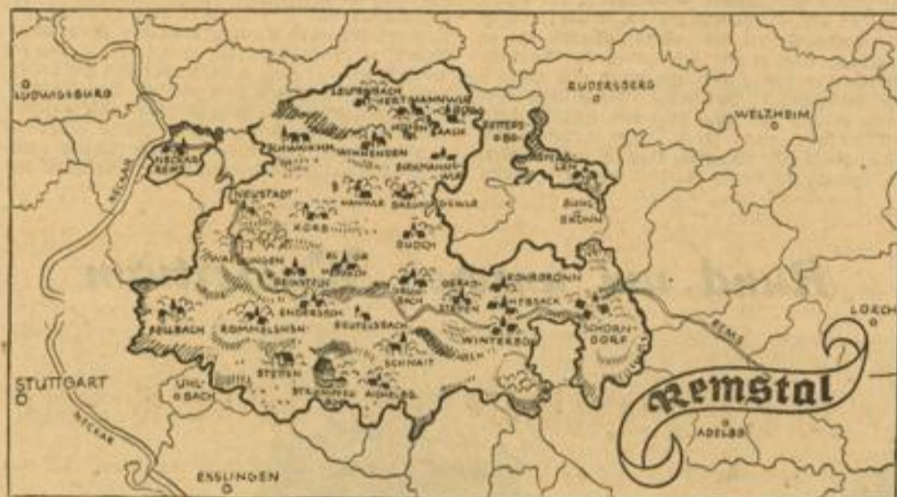
Wo der schwäbische Wein wächst