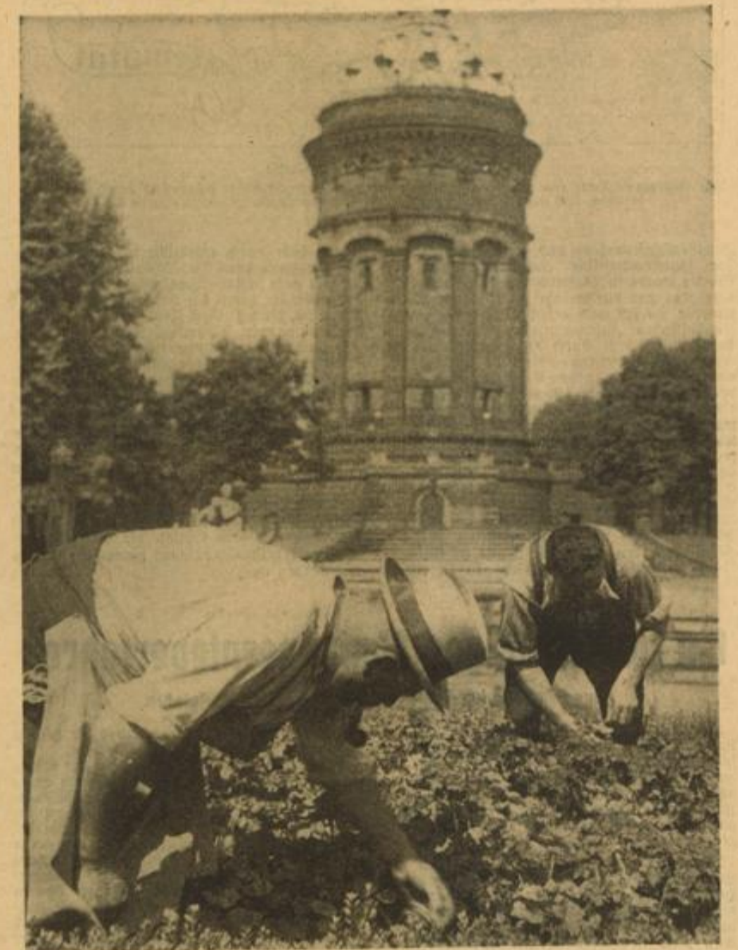
Der Pflege der Anlagen um das Wahrzeichen Mannheims wurde von jeher besondere Aufmerksamkeit gewidmet