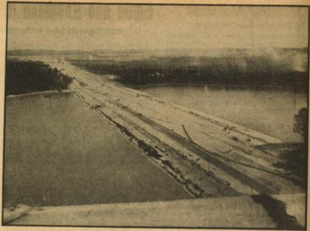
Die Neugestaltung des Reichsparteitagsgeländes Blick auf die im Bau befindliche Große Straße, die von der Kongreßhalle durch den Dutzendteich zum Märzfeld führt, vom Modell der Kongreßhalle aus gesehen.

Sturm im Stillen Ozean Alles ging im Anfang der Reise gut, wie es ja immer bei solchen Dingen zu geben pflegt. Aber mitten im „Stillen“ Ozean tobte auf einmal ein solcher schwerer Sturm, daß die beiden Schrauben Wände hatten, den 12000 Tonnen schweren Schiffskörper vorwärts zu dringen.