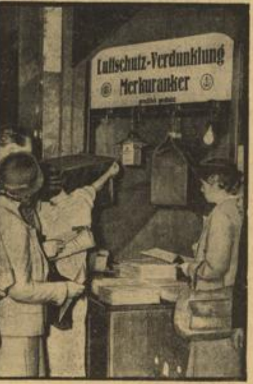
Berliner Luftschutzwoche hat begonnen Verkauf von Lampen-Verdunkelungsgeräten in den Papiergeschäften

In der Völkerbundsversammlung wurde auch über die Wiederwählbarkeit der Türkei abgestimmt. Die Türkei blieb ebenfalls in der Minorität, da sie 25 Stimmen erhielt und damit die Zweidrittelmehrheit von 34 ebenfalls nicht erreichte.