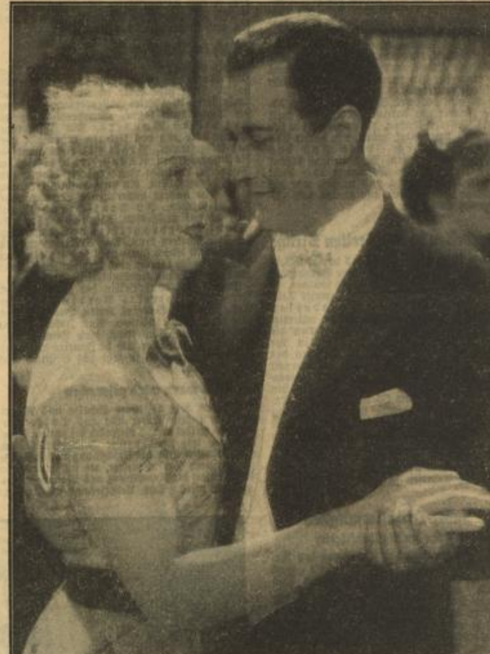
Ein schönes Paar: Anny Ondra und Hans Söhnker in dem Tobis-Magna-Film „Der Unwiderstehliche“