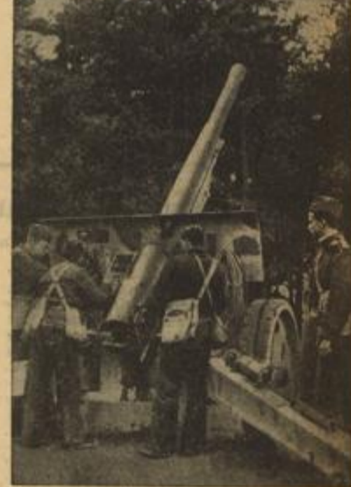
Manöver in Schweden Kästentartillerie während der schwedischen Herbstmanöver, die jetzt ihren Anfang nehmen.

DNB München, 20. Sept. Die 425 italienischen Arbeitskameraden, die am Samstagvormittag in der Hauptstadt der Bewegung eintrafen und am Abend Gäste der NS-Gemeinschaft „Kraft durch Freude“ waren, suchten am Sonntagvormittag, geführt von Männern der nationalsozialistischen Bewegung, das Mahnmal vor der Feldherrnhalle auf. Hier ehrten sie die gefallenen Nationalsozialisten. Ein großer Kranz mit Schleifen in den italienischen und römischen Farben und eine Mäute ehrfürchtigen Schweigens, während dessen die H-Wache präsentierte, gaben den ersten Blutzugungen der Hitlerbewegung. Die italienischen Arbeitskameraden defilierten vor dem Mahnmal, um dann am Kriegerdenkmal vor dem Armeemuseum auch der Gefallenen des Weltkrieges zu gedenken. Die italienischen Arbeiter sind mittlerweile nach Nürnberg weitergereist.