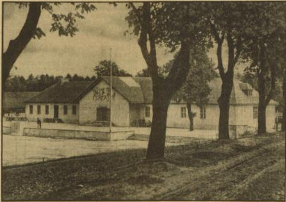
Die Adolf-Hitler-Weihestätte in Pasewalk

Eine Rückkehr zu dieser Linie, die von Italien und Deutschland konsequent verfolgt worden ist, kann also nicht, wie zum Teil in irreführender Weise in der ausländischen Presse behauptet wird, als eine sensationelle Wendung der Haltung Italiens und Deutschlands angesehen werden. Mit den letzten Beschlüssen im Nicht-Einmischungsausschuss ist übrigens keineswegs eine restlose Lösung der Freiwilligenfrage erfolgt. Der Nicht-Einmischungsausschuss muß seine Schlüsse nicht in sich selbst fassen. Solange die Zustimmung Sowjetrußlands zu den am Mittwoch ins Auge gefassten Vorschlägen nicht einwandfrei feststeht, ist es daher verfrüht, von einem vollständigen Wandel der Lage zu sprechen.