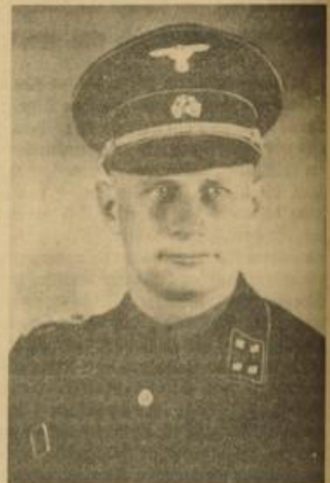
Der neue Sturmabannführer