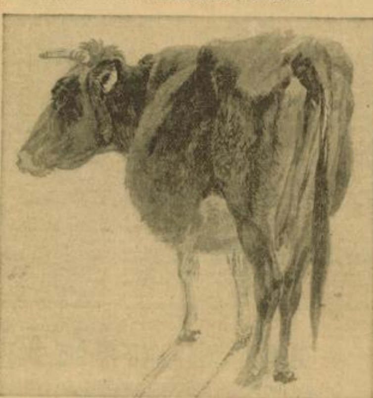
Wilhelm von Kobell: „Kuh“

Führend die Aufmerksamkeit der Beschauer gerade auf die Eigenschaften der Arbeiten gelenkt wird, auf die es auch für unser Kunstschaffen ankommt.