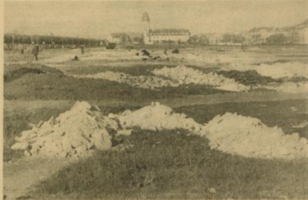
Von der Kronprinzenstraße bis zur Hauptfeuerwache ist nunmehr eine vollkommen geschlossene Fläche entstanden. Die jetzt noch anzuliefernden Flächen mit Schutt dienen lediglich dazu, die während der Ausführung entstandenen Absenkungen und entstandene Vertiefungen noch auszufüllen.

Die Anmeldungen für die Lehrgemeinschaften und Aufbaukameradschaften müssen schnellstens auf der Geschäftsstelle des Berufserziehungswertes der DAF in Mannheim, C 1, 10, abgegeben werden.