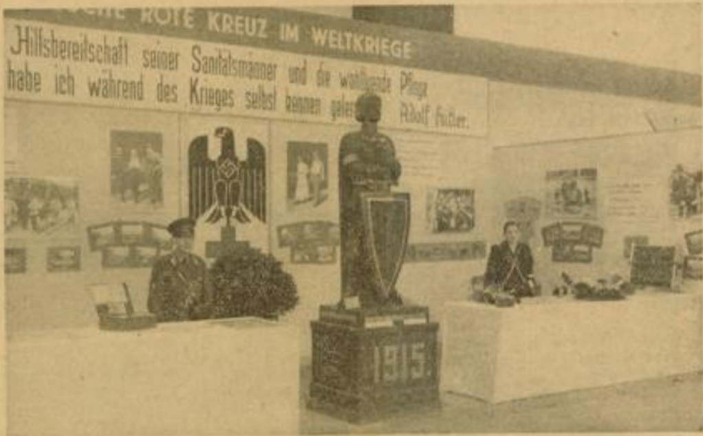
Der Stand des Deutschen Roten Kreuzes in der Weltkriegsausstellung