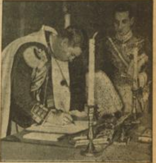
Die Inkraftsetzung der neuen rumänischen Verfassung

Trotz allem aber konnte der Geist nicht völlig