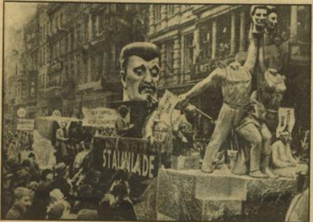
Köln Rosenmontagszug hochaktuell. Der Triumph der Kopflosigkeit oder „Mir han kein Kopp-Ping (Kopfschmerzen) mieh“, eine hochaktuelle Illustration zu dem neuesten Schauprozeß in Moskau im Kölner Rosenmontagszug. Weltbild (M)

In der Luft aber blieb Deutschland gefesselt. Mit Mühe und Not, durch ein Ausnutzen aber