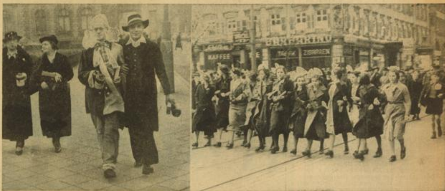
Ein Bild von dem lustigen Straßentreiben in den Mannheimer Straßen. Eine Schar Mädel mit Schlupf im Haar benötigt fast die ganze Straßenbreite. — Das Villinger Hansel, das als WHW-Abzeichen bei allen Faschnachtsveranstaltungen verkauft wurde, hat hier sehr lebendige Formen angenommen.

Die Jubiläums-Kappenfahrt am Faschnachtstag / Großes Straßentreiben und quietschfideler Ausklang