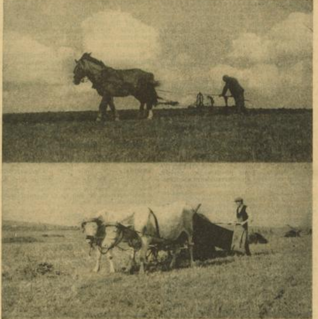
Die Zeit der Frühjahrsbestellung naht. Immer noch sind die Zugtiere die treuesten, unentbehrlichen Helfer des Bauern.