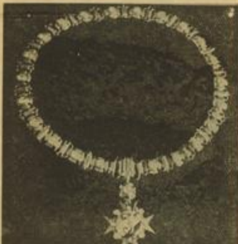
Die Jubiläumskette für den Feuerlösch-Präsidenten — ein Werk edelster Goldschmiedearbeit des letztjährigen Prinzen Karneval. Aufn.: Jütte

Der Vorort Feudenheim ließ es sich im Jubiläumsjahr seiner einheimischen Karnevals-gesellschaft „Heiterkeit“ nicht nehmen, den Feudenheimern einen Faschnachtzug „vorzusetzen“, der aus mehr als einem Dutzend Wagen und zahlreichen Fußgruppen bestand.