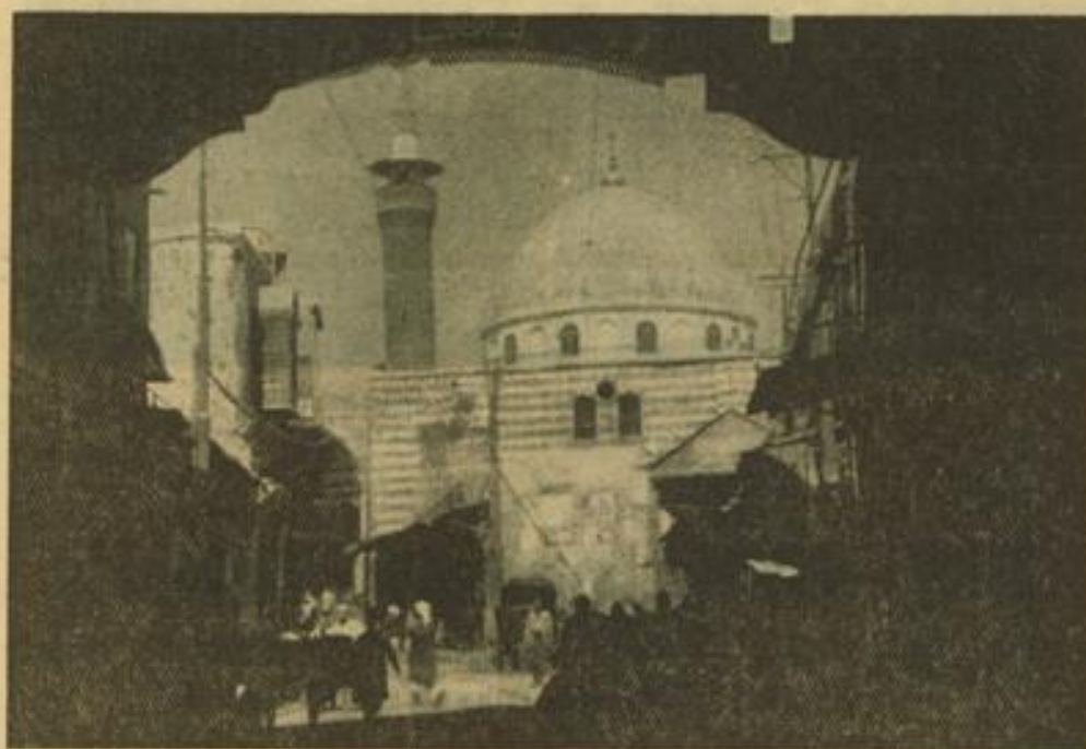
Ein typisch orientalischer Durchblick in Damaskus

als einer Stunde in Beirut, das ca. 80 Kilometer südlich liegt. Man mietet sich einen Platz in dem Taxi, das für fünf Personen Raum hat und bezahlt einen lächerlichen Betrag. Nach Beirut kostet es 14 Lire, das ist etwa über 2 RM. Es geht immer am Meer entlang. Zu Füßen der wilden Felsformationen des Libanon, der wie ein einziger Block von mehr als 2000 Meter Höhe und etwa 150 Kilometer Länge den Küsten Vorderasiens vorgelagert ist. Die Straße steigt in die Berge hinauf, führt durch