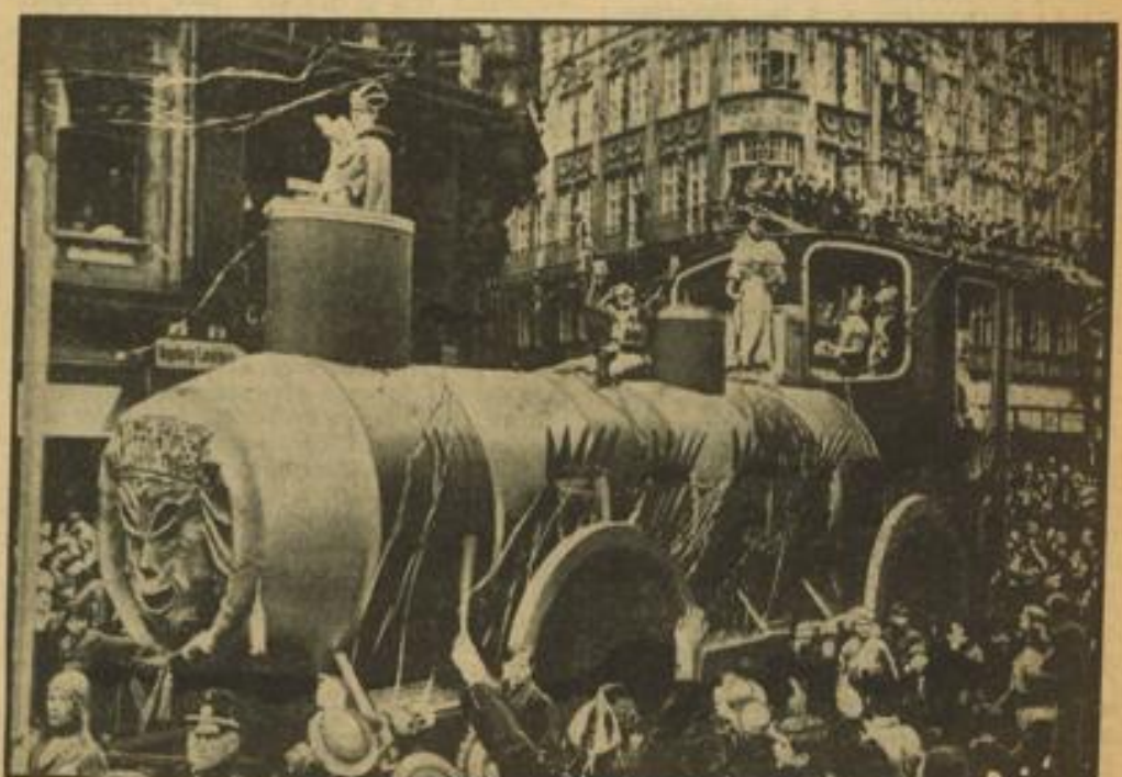
München im Fasching. Die riesige Lokomotive im Münchener Faschingszug mit Faschingsprinz Michl I. und seiner Prinzessin.

rt t durch kurz- ellen entral epellit erlin 443 98 ager ng illy acken bauer 635 n-