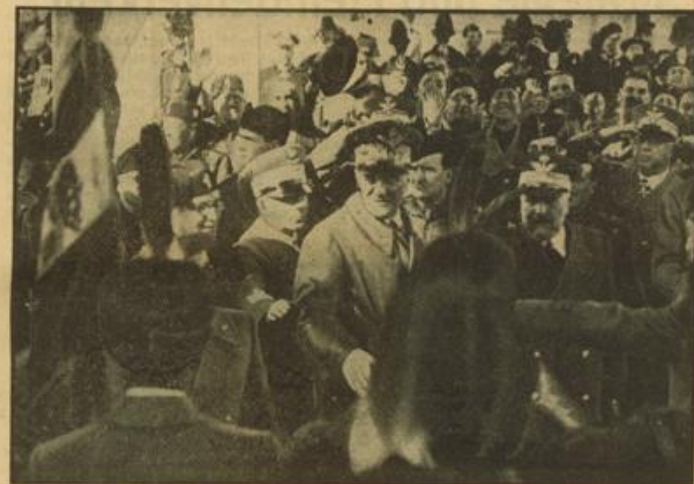
Vizekönig Graziani kehrt aus Abessinien heim

Diese ehemals führenden bolschewistischen Funktionäre der Nationalitätengebiete werden vermutlich die Rolle lokaler Agenten des „Blodes“ der Hochverräter zu spielen haben;