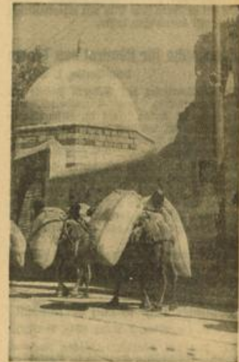
Straßenbild in Damaskus