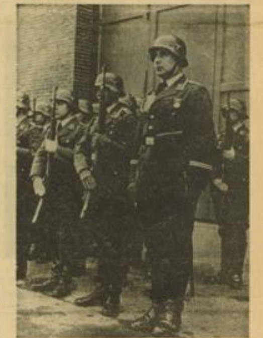
Während der Paradeaufstellung beim Tag der Luftwaffe im Fliegerhorst Sandhofen.

Zuhause und an der Arbeitsstätte findest du im Schutze des Luftschutzes vor Kampfstoffen. Im Freien, auf der Straße schützt dich allein die Volksgasmasken.