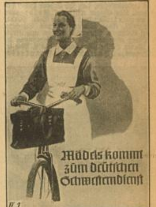
NS-Schwesterenschaft / Deutsches Rotes Kreuz / Reichsbund der Freien Schwestern

Die Reise ist debitsenmäßig gebildet und wird im Rahmen der monatlichen Debitenfreigabe von 10 RM durchgeführt. Der ausführliche Fahrplan ist kostenlos bei der Heidelberger Straßen- und Bergbahn AG., Heidelberg, Bergheimerstraße 4, erhältlich.