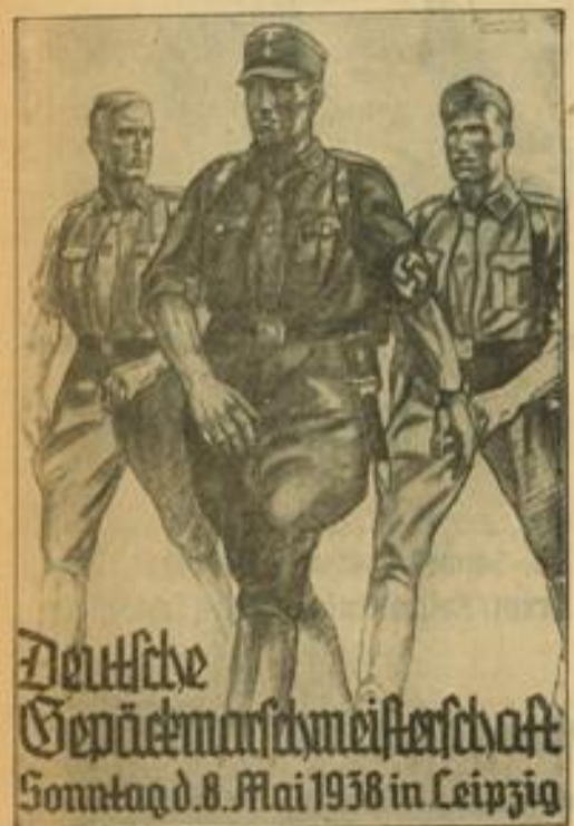
Deutsche Gepäckmannschaftsmeisterschaft Sonntag d. 8. Mai 1938 in Leipzig