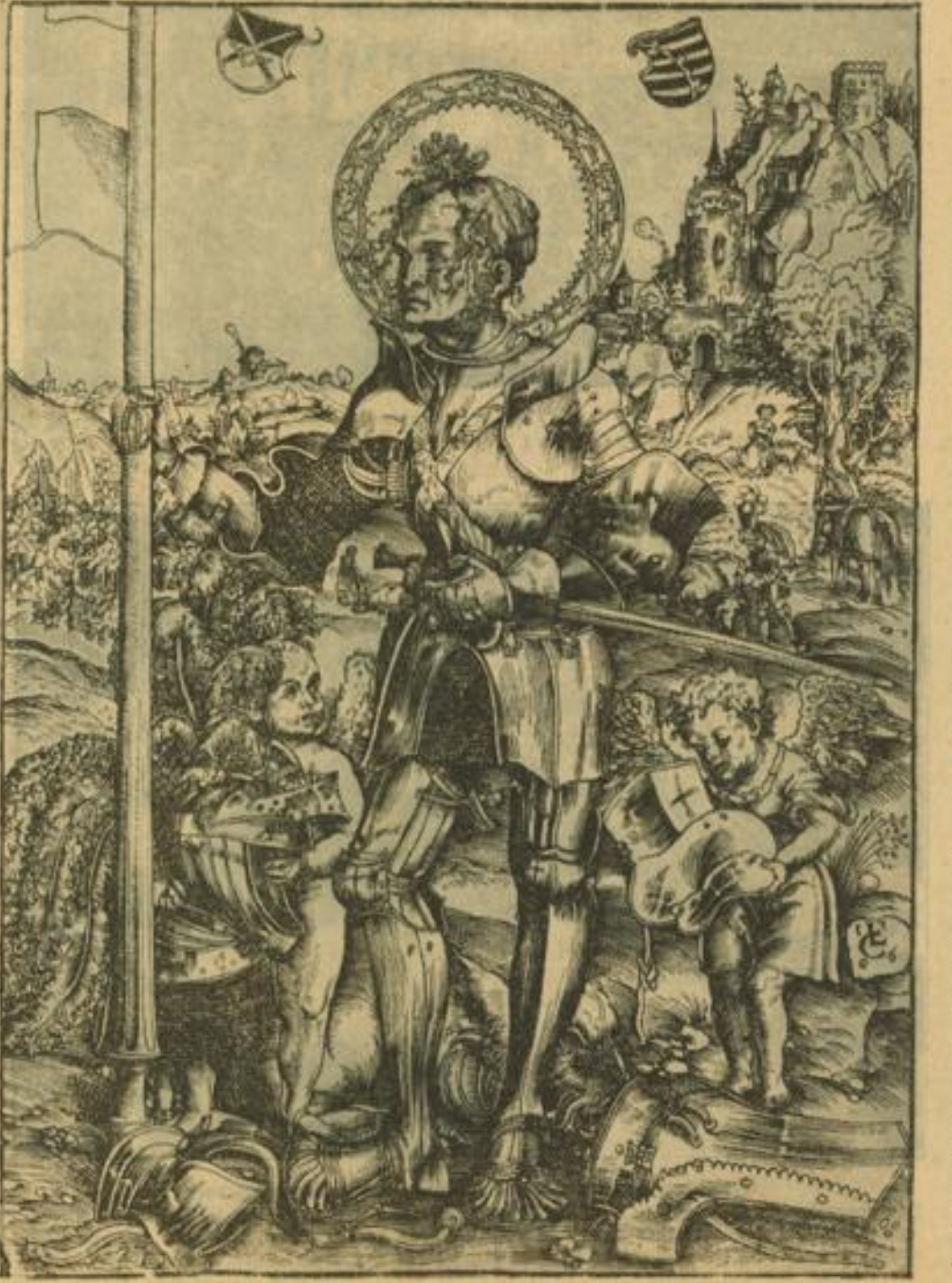
St. Georg von Lucas Cranach