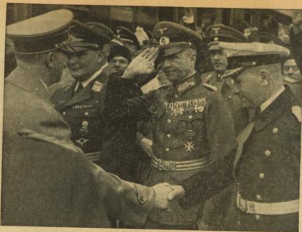
Der Führer verabschiedet sich von den Oberbefehlshabern der drei Wehrmachtsteile. Unser Bild zeigt Adolf Hitler, als er sich auf dem Anhalter Bahnhof von den Oberbefehlshabern der drei Wehrmachtsteile, Generalfeldmarschall Hermann Göring, Generaloberst von Brauchitsch und Generaladmiral Raeder, verabschiedete.