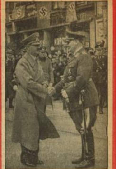
Der Führer verabschiedet sich von Generalfeldmarschall Göring, der vom Führer während seiner Abwesenheit mit der Vertretung betraut wurde.

Formationen der italienischen Wehrmacht und der faschistischen Miliz erwiesen dem Obersten Befehlshaber der deutschen Wehrmacht ihre Ehrenbezeugung. Männer, Frauen, Jungen und Mädchen begrüßten den Führer ununterbrochen mit ihren hitlerischen Jubelrufen „Eia eia alala“ und „Duce Hitler — Duce Hitler“. Jedes Haus, das an der Strecke liegt, trägt die Fahnen Italiens und Deutschlands, die in der Sonne leuchten, und auf jedem Bahnhof erklangen die mit-