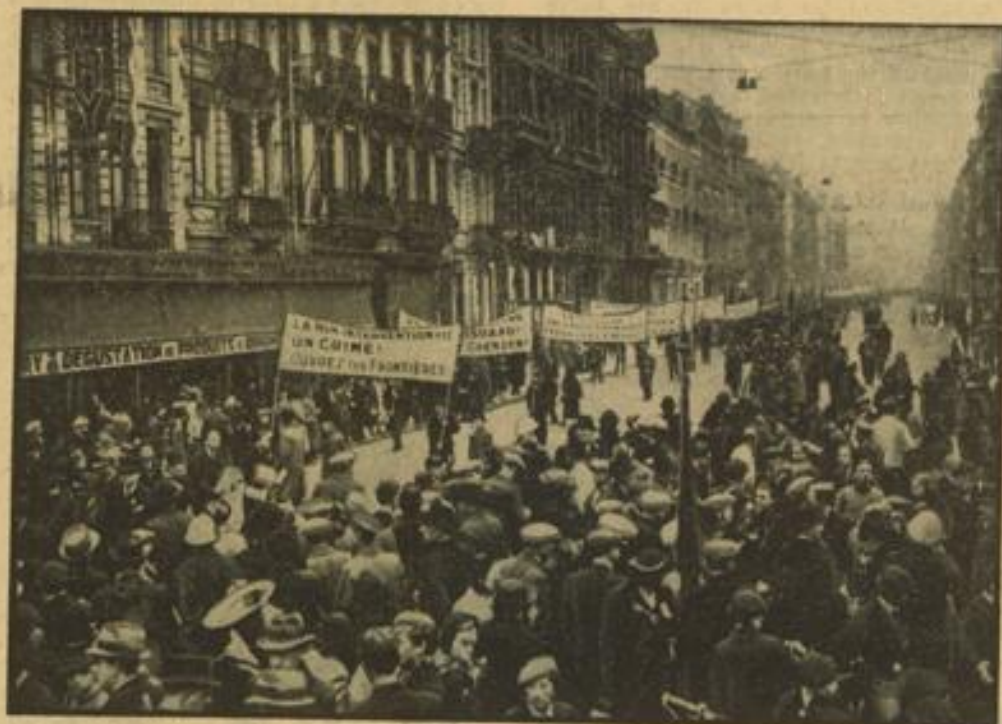
Der 1. Mal im Ausland. Marxistische Demonstrationen zogen in den Straßen Brüssels zur Einmischung in Spanien auf.

Ohne Vertrauen, so betonte Chamberlain, könne es keinen Frieden in den internationalen Angelegenheiten geben. Vertrauen könne man aber nur schaffen, wenn man Beschwerden, Meinungsverschiedenheiten und Verbächtigungen beseitige. Das sei eine Aufgabe, die man nicht auf einmal erfüllen könne. Bei den Verhandlungen mit Italien sei die britische Regierung der Ueberzeugung gewesen, daß mit gutem Willen und Bemühen auf beiden Seiten eine große Gefahr beseitigt werden könne. Dabei habe man die Dinge so sehen müssen, wie sie tatsächlich seien.