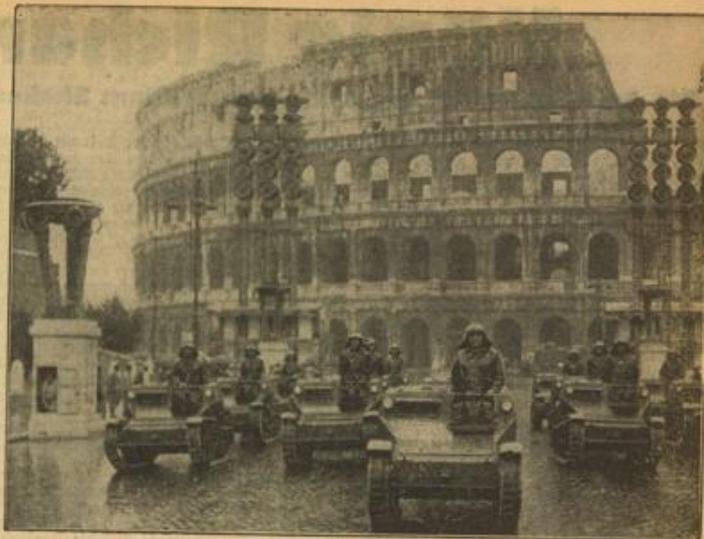
Jahrtausende begegnen sich. Auf der Via dei Trionfi in Rom fand vor dem Duce die Generalprobe für die große Führer-Parade statt. 30.000 Mann aller Waffengattungen marschierten über vier Stunden lang am Duce vorüber. — Hier sieht man Panzerwagen während der Parade vor dem Colosseum. (Scherl-Bilderdienst-M.)