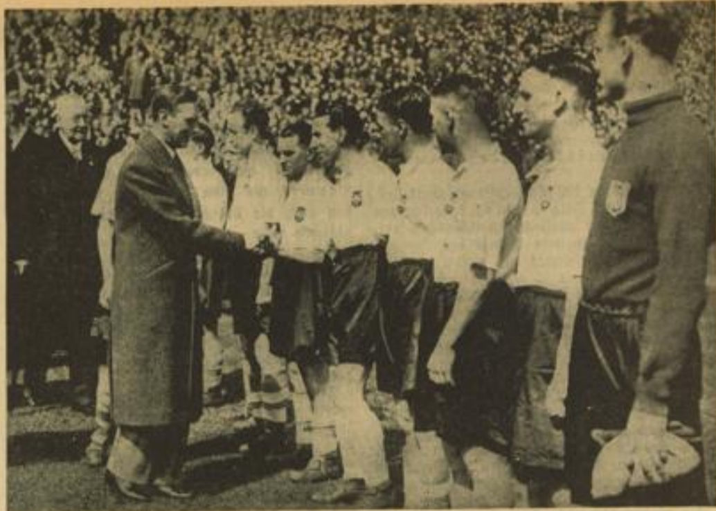
Der englische König, der mit der Königin dem Pokal-Endspiel beiwohnte, begrüßt vor Kampfbeginn die Mannschaft von Preston Northend...

Der Gau Baden hat jetzt auch die Spiele der ersten Hauptrunde um den Tschammerpokal am 8. Mai festgelegt.