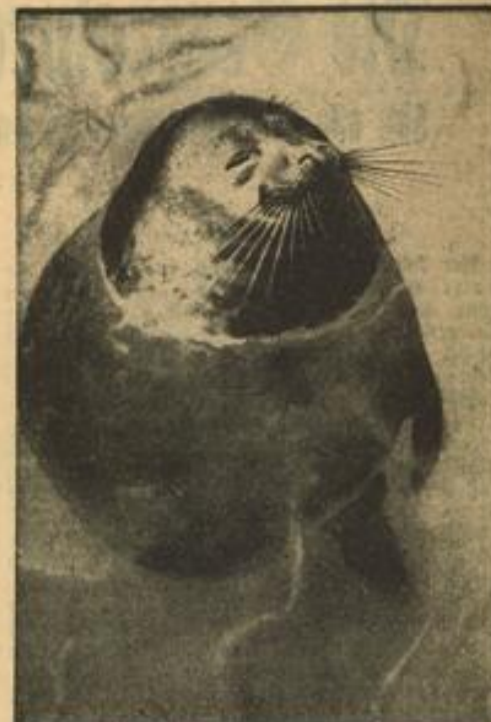
Schwanz? — Stört mich nicht

In allen Fällen sind gegen das Sperrsystem anrennende Flugzeuge zum Teil abgeflirt, zum Teil zur Landung gezwungen. Wenn nur wenige derartige Fälle vorkommen, so hatte dies seinen Grund darin, daß die Flieger sich scheuten, gegen durch Ballonsperren geschützte Objekte zu fliegen. Andererseits ist ein Abschuß eines Ballons, den der Theoretiker für ziemlich