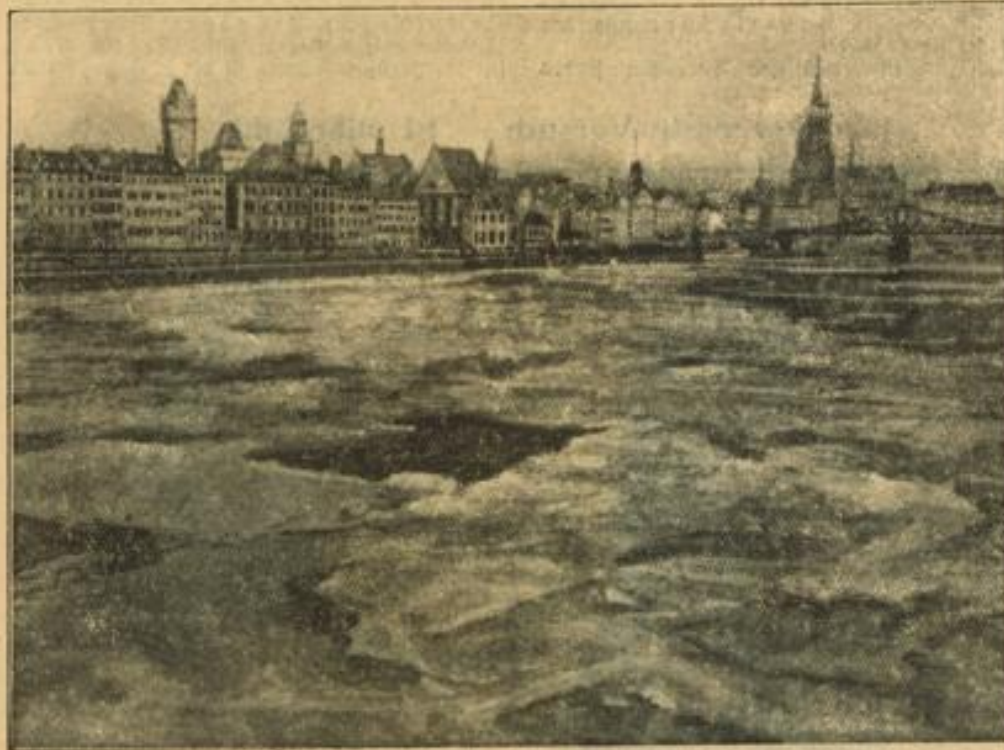
Die Schifffahrt auf fast allen deutschen Strömen ist eingestellt