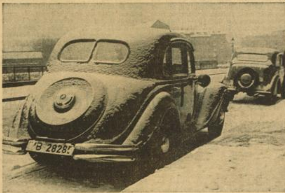
Ein winterliches Stimmungsbild aus der Großstadt; wenn man am Donnerstag seinen Wagen einige Zeit parkte, dann fand man ihn leicht „überzuckert“ wieder vor.