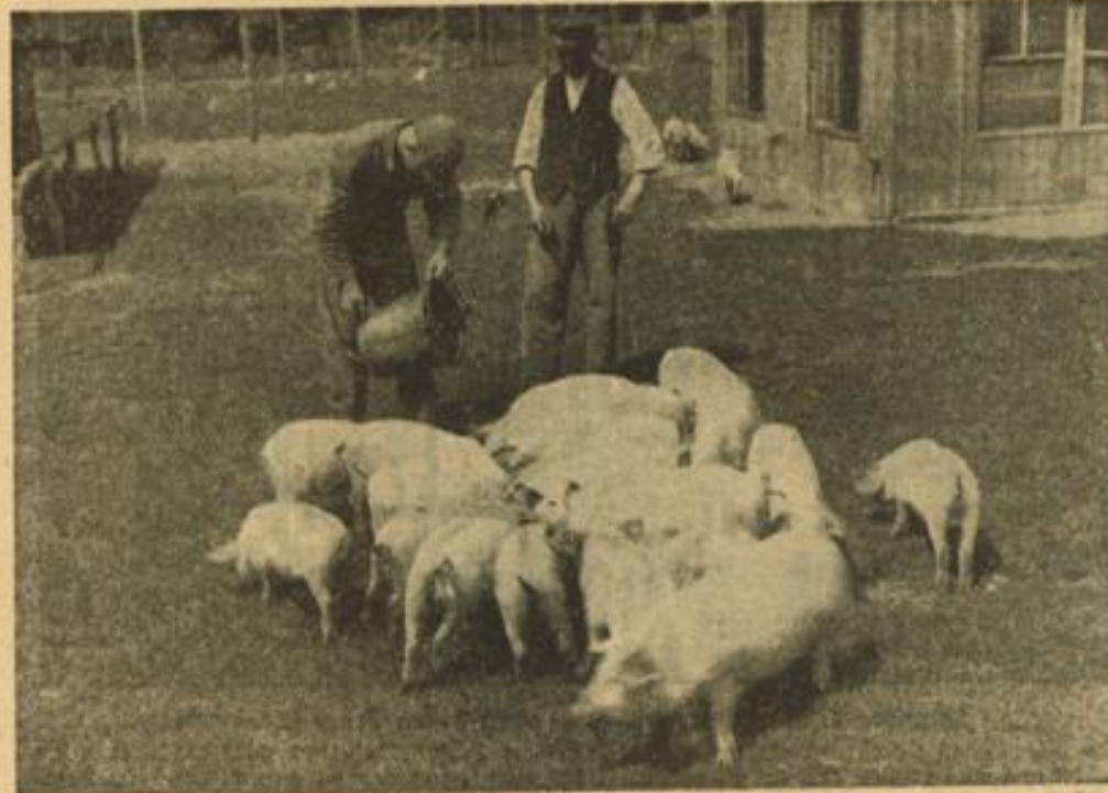
Ein Landdienstjunge lernt das Schweinefüttern — auch das will gelernt sein

den „Widder Guffoss“ haben und uns gefragt wurde, daß dieses wunderbare Schiff dem