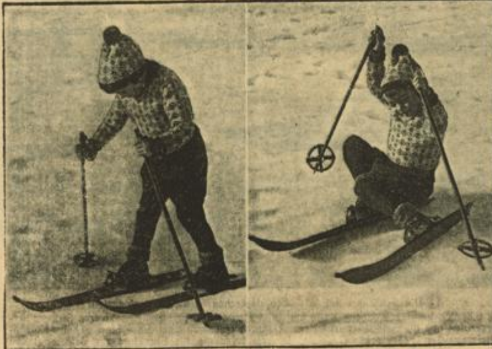
Winterfreuden des jüngsten Schneeschuhläufers