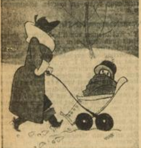
Zeichnung: E. John