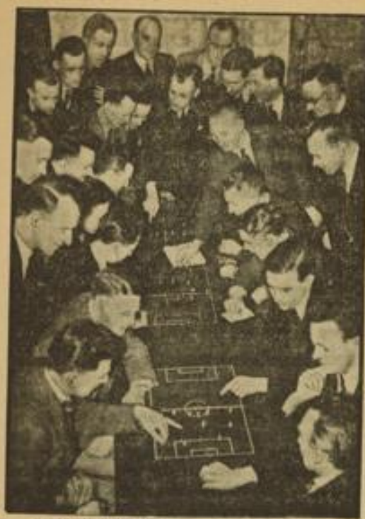
Fußballschiedsrichter am grünen Tisch