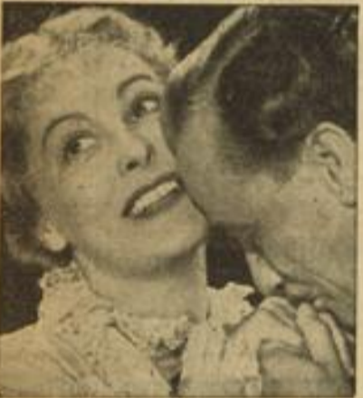
Marianne Hoppe als Effi Briest