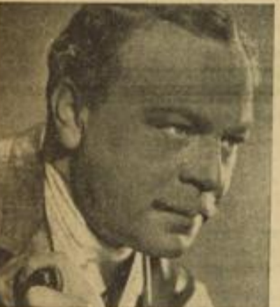
Paul Hartmann als Major a. D. von Crampas den hervorragenden Terrahim: