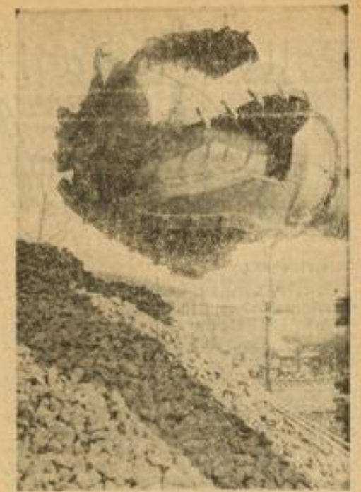
Wie ein Vorzeltungsheuer Ein riesiger Kugel-Schauler, der eine stündliche Leistung von 70 bis 80 Tonnen erzielt.