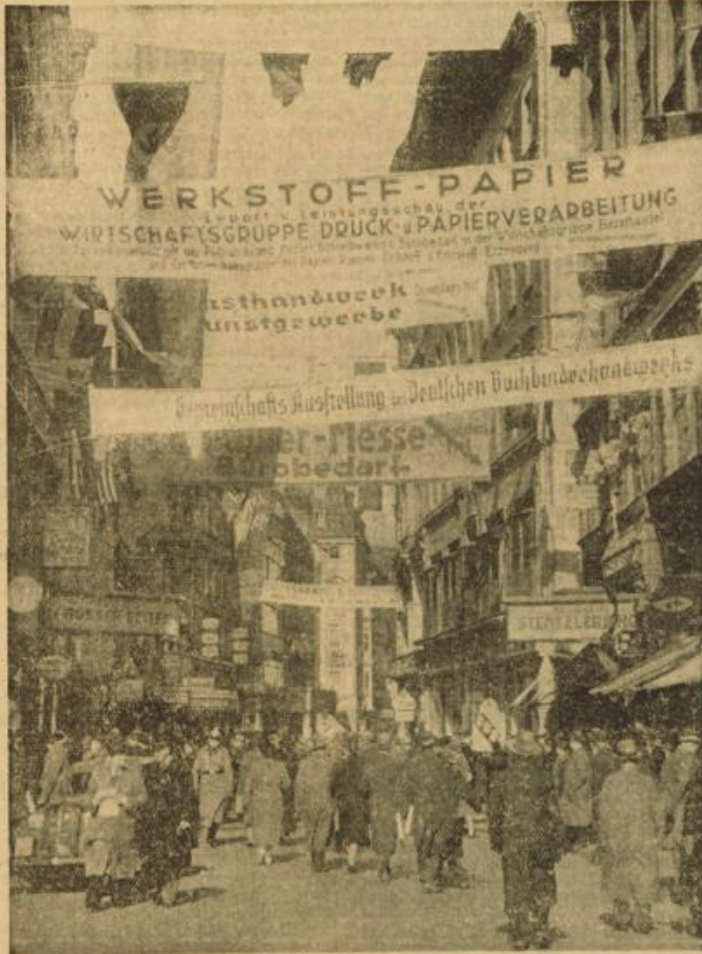
Von der Leipziger Frühjahrsmesse Leben und Treiben in der Peterstraße in Leipzig.

Wenn man den Weg recht verstehen will, den das liberale England zu den Verhandlungen heute zurückgelegt hat, so muß man sich die Lage klar machen, in der sich England heute wirtschaftspolitisch befindet.