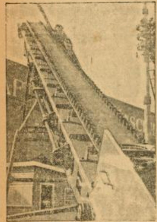
Ein neuartiges Seiltransportband ermöglicht durch wellenförmige Bänder an den Seiten, das Material stoll in die Höhe zu fördern.

Seit dem Kriege, besonders aber in den letzten Jahren, ist England sich nun immer mehr inne geworden, daß die Versorgung des Landes von außen sowohl mit Nahrungsmitteln als auch mit Rohstoffen eine nationale Gefahr birgt.