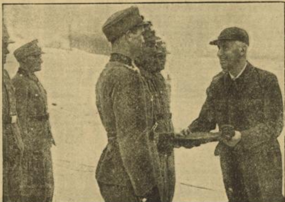
Reichsminister Dr. Frick beim Abschluß der Deutschen Polizei-Skimeisterschaften in Kitzbühel