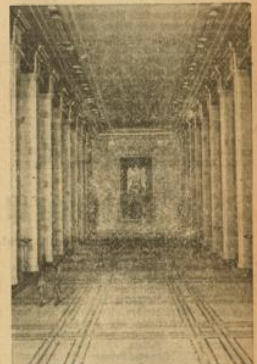
Entwurf für eine Feierhalle der Hitler-Jugend Die oben erscheinende neue Zeitschrift „Der deutsche Baumeister“ bringt in ihrem ersten Heft eine interessante Abhandlung über das Bauwesen im Dritten Reich...