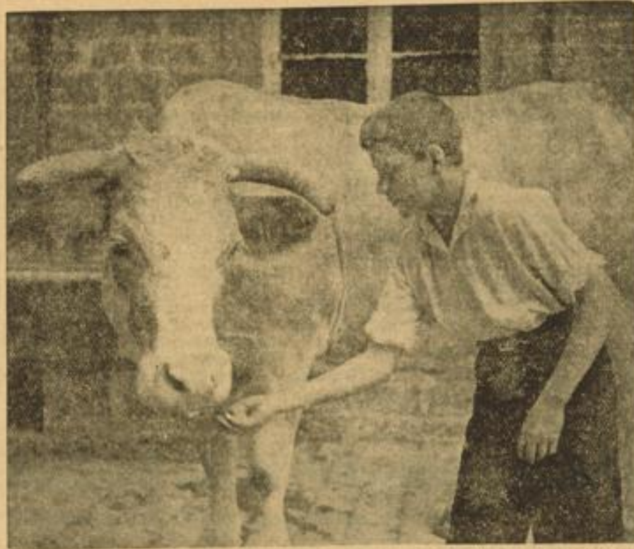
Ein Musterexemplar auf der Weide und sein Freund. (Archivbild)

Zur Landestagung der badischen Rinderzüchter in Karlsruhe