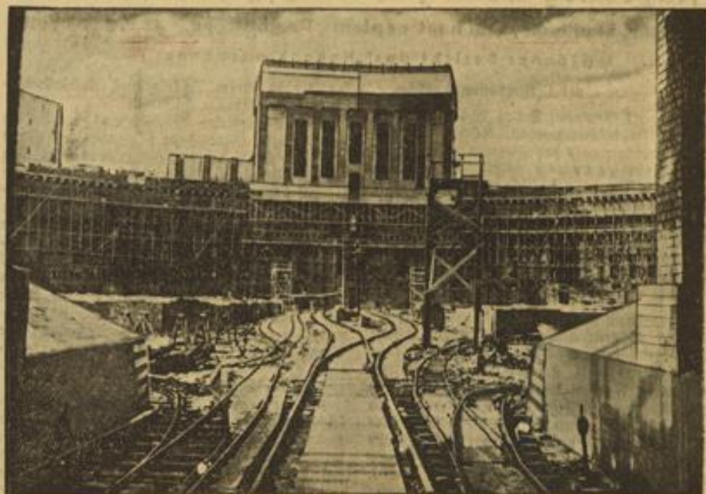
Auch im Winter wurde ununterbrochen an den Bauten des Reichsparteitaggeländes in Nürnberg gearbeitet. Unser Bild: Der Kongreßbau mit einem naturgroßen Modell des inneren Säulenganges (Mitte). Architekten: Professor Ludwig Ruff J. und Franz Ruff.