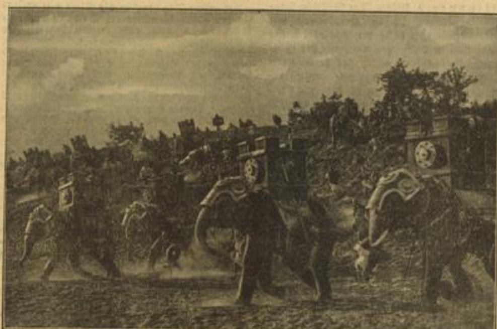
Tanks des Altertums. Hannibal setzt seine Elefanten zum Sturmangriff ein. Eine Szene aus dem preisgekrönten Degeto-Film „Karthagos Fall“.