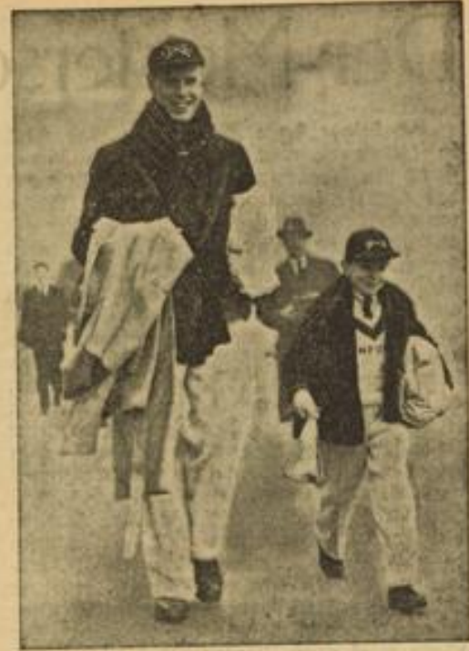
Zwei Mann von einem Boot

Der riesige Schlagmann und der kleine Steuermann des Oxforder Rennachters auf dem Wege zum Training für das große Rennen gegen Cambridge.