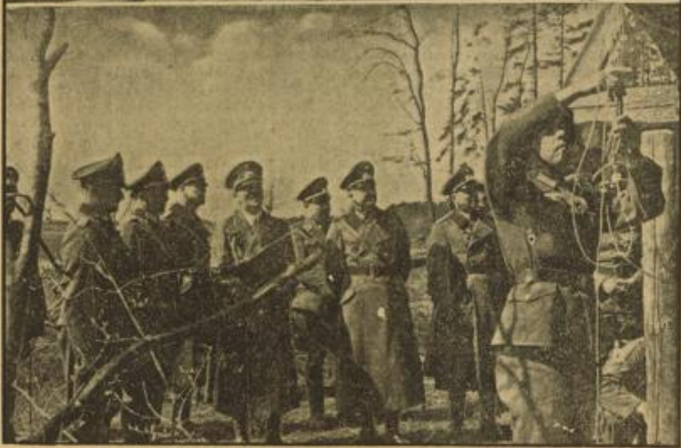
Der Führer bei seinen Rekruten in der Ostmark

Der Führer und Oberste Befehlshaber der Wehrmacht besichtigte mehrere Standorte der Wehrmacht in der Ostmark, um sich vom Ausbildungsstand des eingezogenen jüngsten Jahrganges zu überzeugen. Unsere Bilder zeigen den Führer bei den Pionieren in Krems. Oben: Pioniere während eines Brückenbaues. Neben dem Führer Generaloberst von Brauchitsch, Unten: An einer Brücke wird eine Sprengladung angebracht.