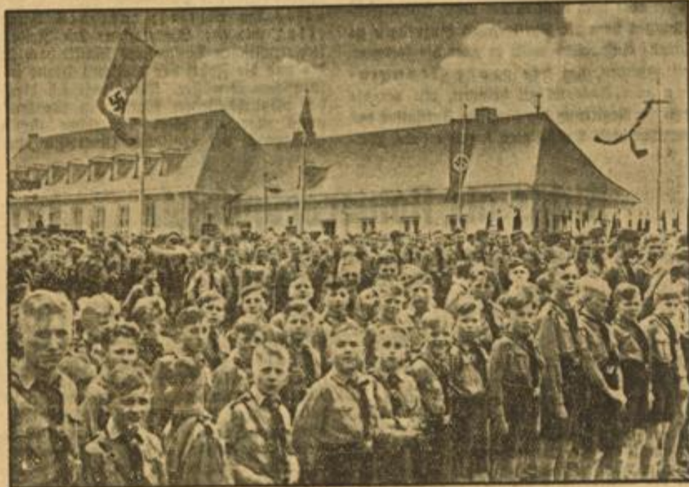
Baldur von Schirach weihte 63 Jugendherbergen

1,75 Milliarden Mark. Demgegenüber betrug der Gesamtwert der landwirtschaftlichen Erzeugung bei einer Gesamtanbaufläche von 20 Millionen Hektar die Summe von 12 Milliarden RM.