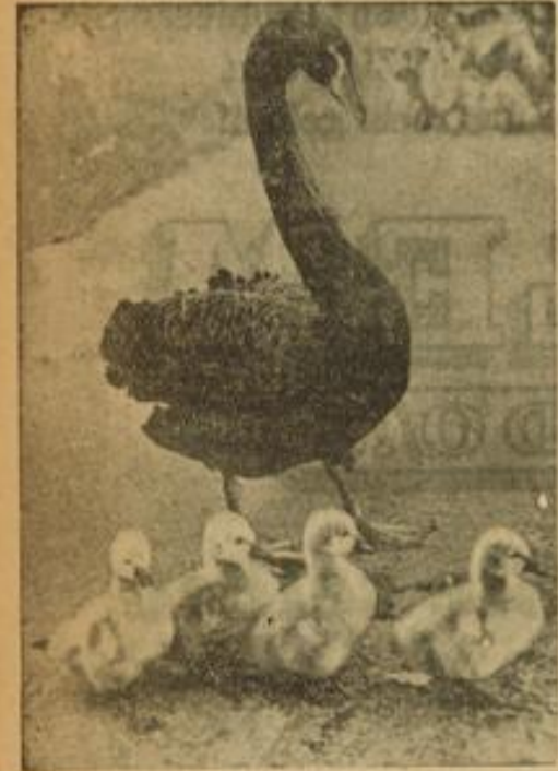
Schwarze Mutter — weiße Kinder Ein schwarzes Schwänenweibchen führt seine vier Jungen zum erstenmal aus. Sie wirken einstweilen noch wie weiße Flaumbällchen.

Als Sie dann am Morgen nach dem Koch Mrs. Mabfield und ihre Geldforderung abweisen, begann die Wirtschaftlerin wiederum, Gloria zu bearbeiten. Mit Erfolg. Später erfuhr sie, daß die Tausenddollarnoten, die sie von Gloria erhalten hatte, da fortlaufend nummeriert, leicht erkannt werden konnten.