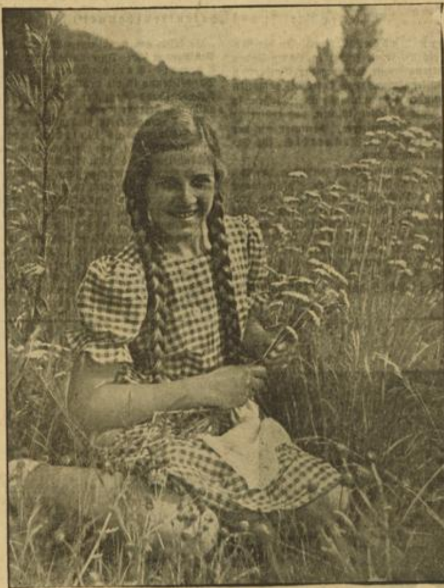
Lachender Frühling Schnelder (M)

„Nein!“, sagte der Anwalt gelangweilt. Er vertorkte die Whiskyflasche und stellte sie wieder in den Schreibtisch.