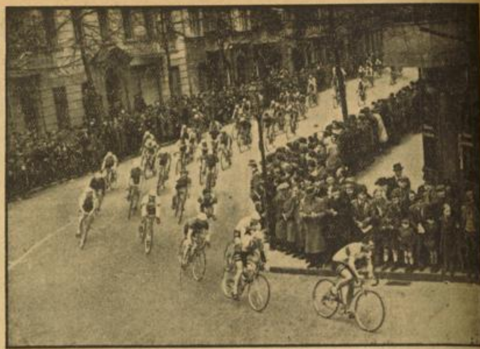
Erstes Straßenrennen der Berufsfahrer

Wir werden bei Behandlung dieses Themas an unsere dunkelsten Zeiten im deutschen Sportleben erinnert, die eigentlich Zeiten höchster Blüte hätten sein müssen, denn das damals zur Verfügung stehende Menschenmaterial war bestimmt nicht schlechter, oder weniger leistungsfähig als die Mannschaft, die uns 1936 die Olympiade gewann.