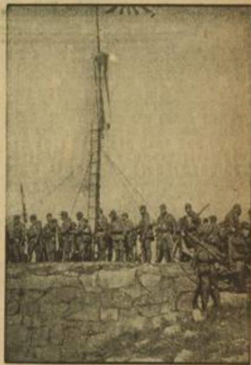
Chinas letzter wichtiger Hafen besetzt

„Nehmen Sie kein Blatt vor den Mund, wenn Sie antworten, ich möchte wissen, worin