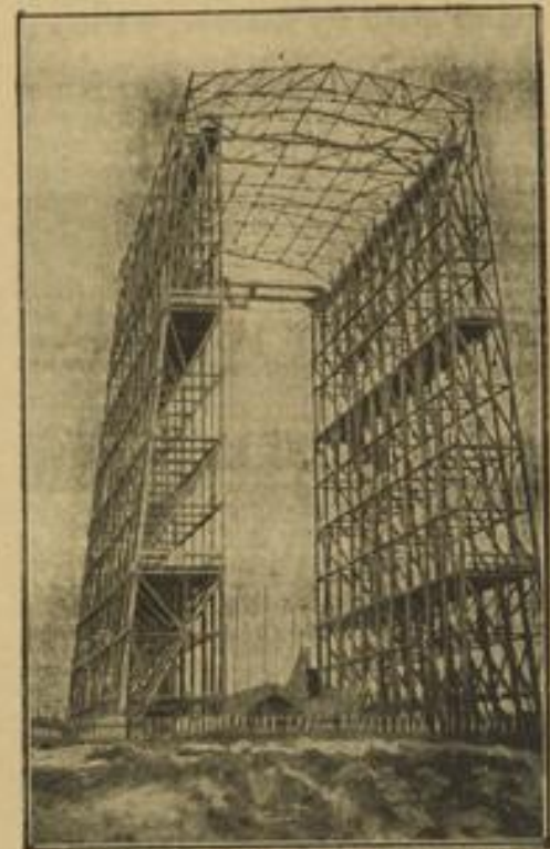
Riesengerüste auf dem Parteitaggelände

Nicht nur die Reisen an sich, sondern auch die KdF-Schiffe lösen die größte Bewunderung aus. Ist „Wilhelm Gustloff“ schon ein Wunderwerk deutscher Schiffsbaukunst, so wird er noch übertroffen von dem zweiten neuen Schiff „Robert Ley“.