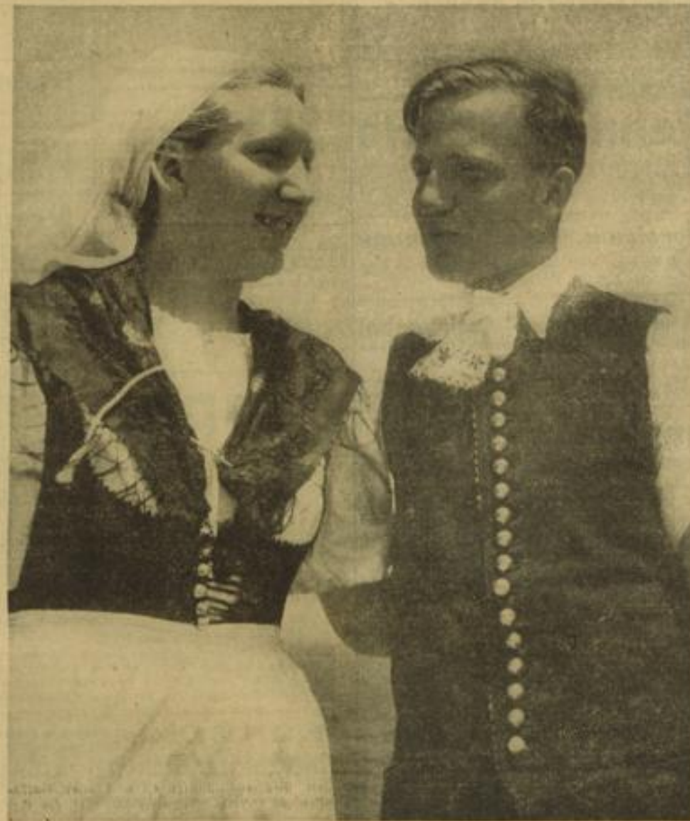
Trachten aus dem Burgenland.