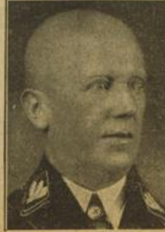
Reichsminister Dr. Lammers