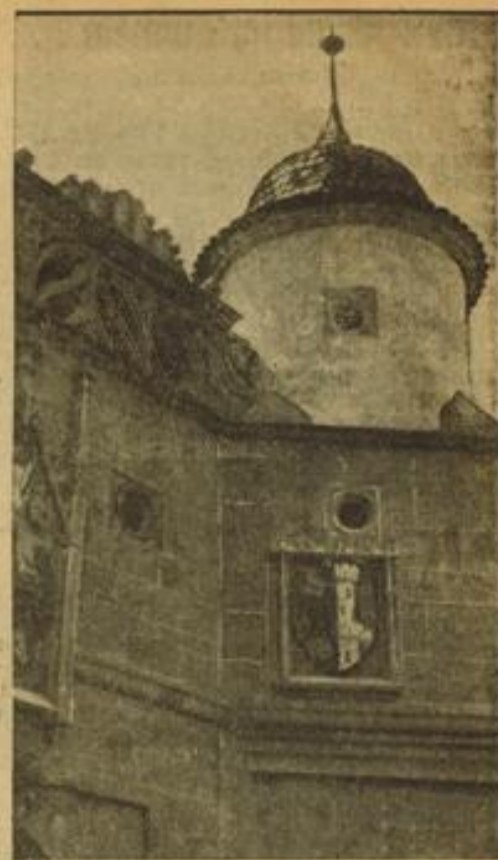
Ein altes Kulturdenkmal vor dem Zerfall bewahrt

Nach wenigen Minuten stand er vor Nummer vier und machte ein langes Gesicht. Wenn die Wohnung in diesem Hause lag, brauchte er sie gar nicht erst zu besichtigen. Dort an das Grundstück grenzte der Hof einer Kohlenhandlung, dessen Umgebung mit schwarzem Staub