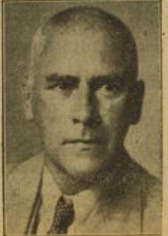
Reichsinnenminister Dr. Frick