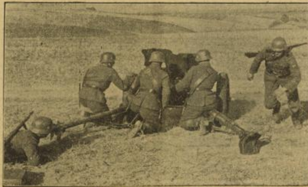
Panzerabwehrgeschütz der „H-Helmwehr Danzig“ wird in Stellung gebracht. Neueste Aufnahme von der H-Helmwehr Danzig, die zum Schutz der bedrohten Stadt Danzig gebildet wurde.

Brot zu backen. Mit Genugtuung nimmt die italienische Öffentlichkeit einen Regierungserlass an, daß eine genaue Prüfung der Getreidemittel, Reis, Zucker und der Teigwaren, bestände das Resultat erbracht haben, daß sie für die Bedürfnisse des Landes auf alle Fälle zureichen.