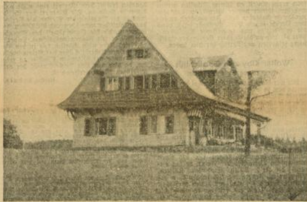
Aut. Lotte Banahat

Wenn nur der Winter schon vorbei wäre, daß Du uns besuchen könntest. Bis dahin muß ich aber noch warten und werde Dir noch manchen Brief schreiben können und Dich herzlich grüßen können, so wie auch heute, Deine glückliche Lotte.