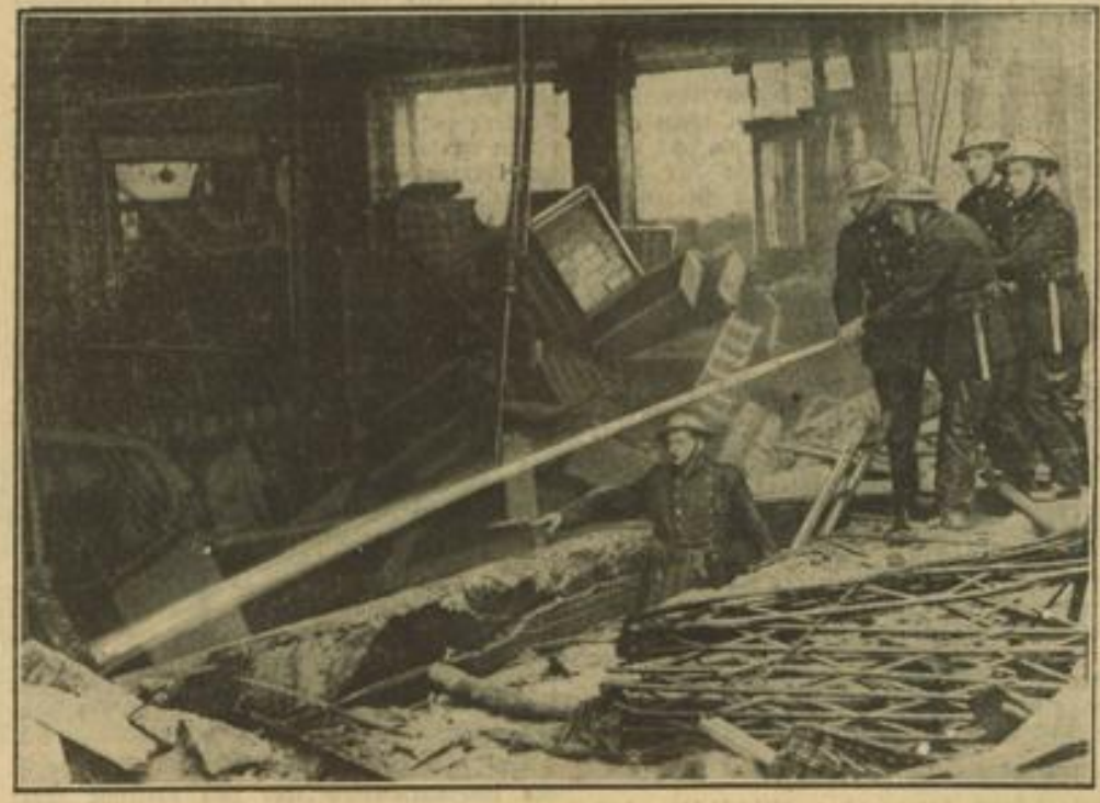
Die Londoner Feuerwehr ist dauernd beschäftigt Durch die dauernden Vergeltungsmaßnahmen der deutschen Luftwaffe gegen London kommt die Feuerwehr der britischen Hauptstadt kaum noch aus den Schuhen. — Unter Bild zeigt Londoner Feuerwehrleute beim Löschen eines Brandes in einem Londoner Lagerhaus nach einem deutschen Bombenangriff.

Berlin, 28. Nov. (H-B-Junt) Nach dem Oberkommando der Wehrmacht vorliegenden Meldungen griffen deutsche Kampfflugzeuge in der Nacht zum 28. November die kriegswichtigen Anlagen von Plymouth an. Zahlreiche große Brände ließen die Wirkung des Angriffs erkennen.