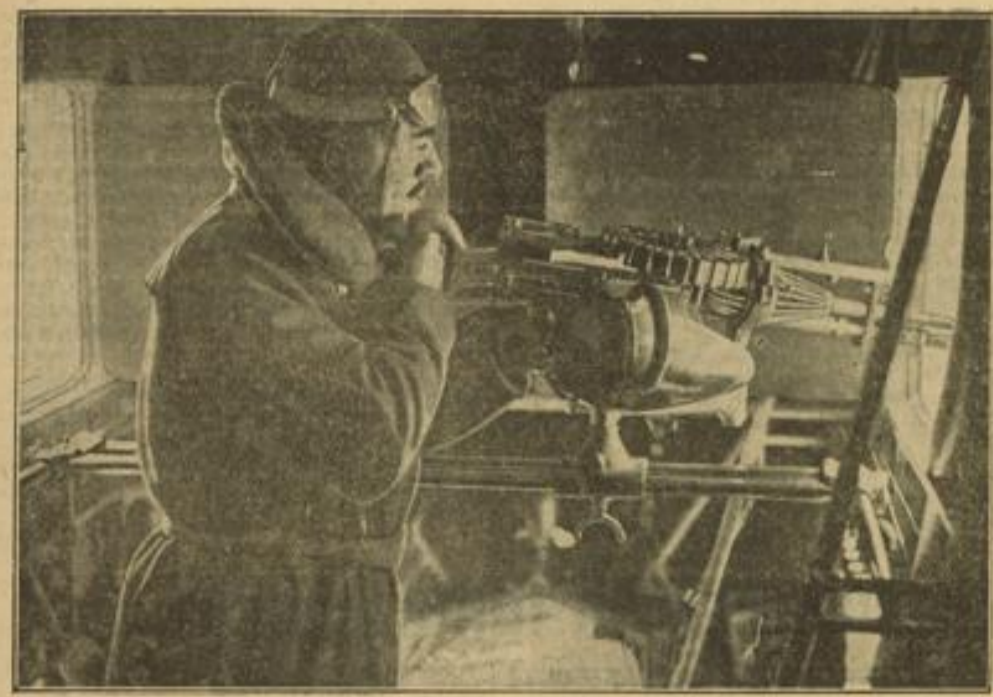
Am Maschinengewehr eines italienischen Bombenflugzeuges Das wachsame Auge des italienischen Kampfliegers verrät, daß ihm keine feindliche Bewegung unbenommen bleibt.