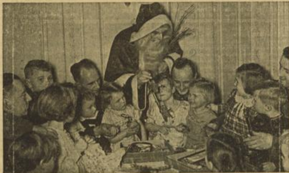
Der Weihnachtsmann beschert

Besondere Aufmerksamkeit wendet die NSB aber im Kreise der Geschädigten den berufstätigen Müttern, den Müttern mit Kleinkindern und den kinderreichen Müttern zu. Um hier jede nur mögliche Entlastung zu gewährleisten, ist bereits Mitte der Woche ein erster Sammeltransport von Kindern und ein weiterer Transport von Müttern mit Säuglingen zur Landverschiebung von Mannheim abgegangen.