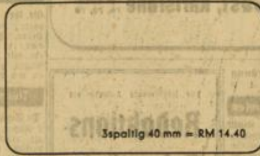
3spaltig 40 mm = RM 14.40

Ist ein einmaliges Ereignis. Alle Ihre Freunde und Bekannten sollen es erfahren. Denken Sie daher rechtzeitig an die Aufgabe Ihrer Verlobungsanzeige in Mannheims größter Tageszeitung, dem Hakenkreuzbanner. Einige Größenmuster finden Sie hier: