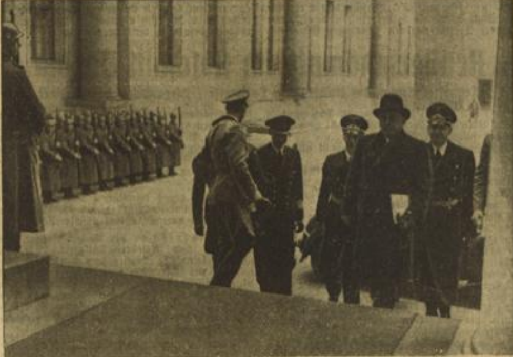
Der Führer empfing Dekanosow

„In dankbarer Würdigung Ihres heldenhaften Einsatzes im Kampf für die Zukunft unseres Volkes verleihe ich Ihnen anlässlich der Verleihung von 200 000 Tonnen feindlichen Handelschiffsräumen als lebendem Offizier der deutschen Wehrmacht das Eichenlaub zum Ritterkreuz des Eisernen Kreuzes.“ Adolf Hitler.