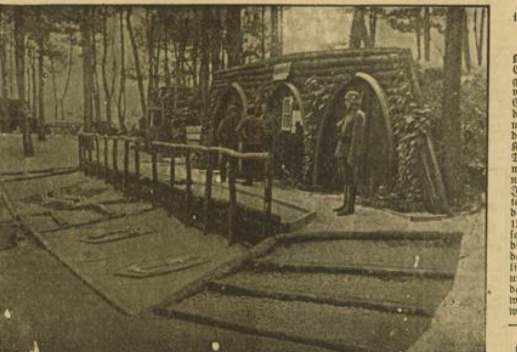
„Unser Helm“ so schrieben die Männer der Marine-Artillerie von der Alantik-Küste nach Hause, besteht aus einer französischen Weibschbaracke, die uns unter „Bildhauer“ und „Gärtner“ sehr schön dekoriert haben. (FK-Menz-Weibbild M)