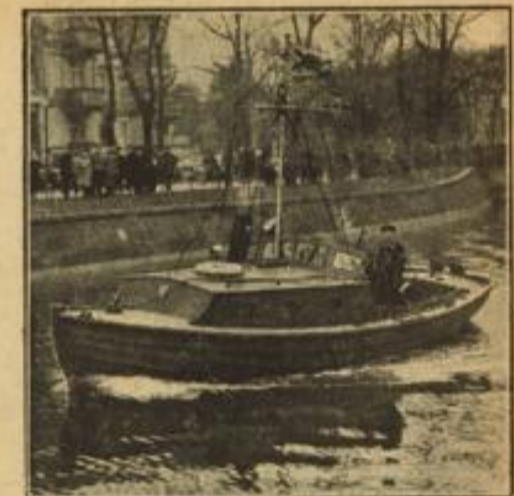
„Zwerg 7“ besucht Berlin. Das kleinste Minensuchboot der Kriegsmarine, „Zwerg 7“, aus einem Küstenschutzverband der norwegischen Westküste...

So legte sich Knobloch am 3. und 4. November berechnend einen Plan zurecht und traf tatkräftig die Vorbereitungen. Er erludete die Wohnung des Opfers, stellte einen Brägel zurecht und schritt am Morgen des 5. November zur Tat.