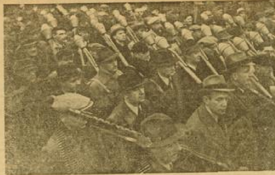
Hunderttausende deutscher Männer waren am Sonntag in allen Gaues des Reiches angetreten, um sich mit dem deutschen Volkstumsgedanken zu bekennen und ihren heiligen Eid auf den Führer abzulegen.

Es ist nur folgerichtig, daß sie nach der Austreibung der Roten aus Spanien dort hinging, wohin sie ihr Herz und ihr Geist zogen - nach Moskau.