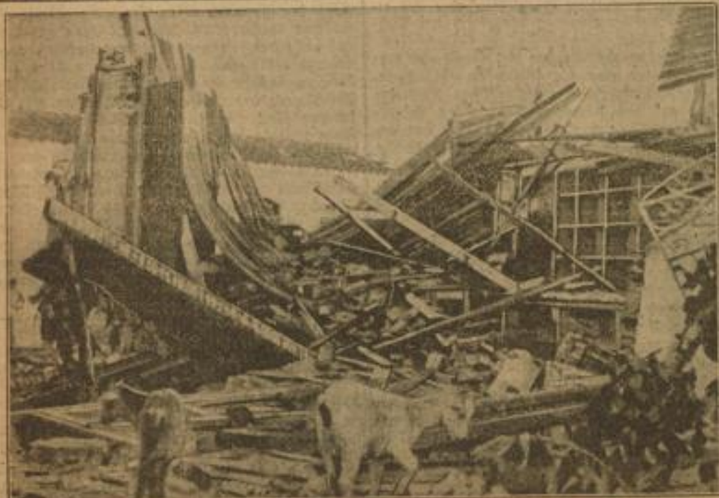
Das erste Bild von der Springlakt-Katastrophe auf Ruda Die Verwüstungen in der Ortschaft Camaguey in Süd-Kuba Die Südküste der Insel Kuba wurde Mitte November von einer furchtbaren Wirbelsturm- und Springlakt-Katastrophe heimgesucht, die etwa 2500 Todesopfer gefordert hat. Die Springlakt drang 8 Kilometer tief ins Land ein und vernichtete ganze Städte.