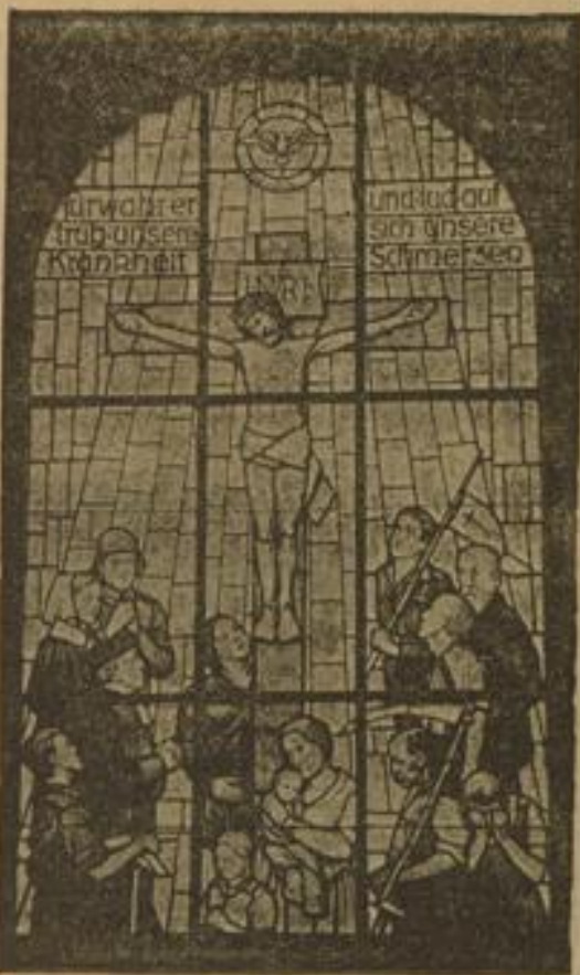
Das Mittelfenster der evang. Kirche in Leimen (Kunstmaler Albert Fink, Karlsruhe)

Vor allem ist der schöne Neubau der Sakristei zu nennen, der sich architektonisch sehr gut in die gotischen Reste einpaßt. Ihm stellt sich der neue Treppenanbau, als