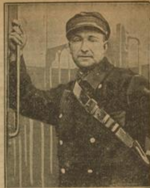
Straßenbahnschaffner promoviert zum Doktor jur.

Dergheim (bei Landau), 24. Nov. Einen gefährlichen Fund machten bei Umbauarbeiten im Schulhof beschäftigte Arbeiter. An der Südwestecke des Kinder-Schulhofes stießen sie in ganzer geringer Tiefe auf 13 geladene Granaten, Kaliber 75 und 105 Zentimeter. Die Geschosse wurden unter Aufsicht eines Beamten der Landespolizei außerhalb des Ortes durchziehender österreichischer Artillerie eingegraben.